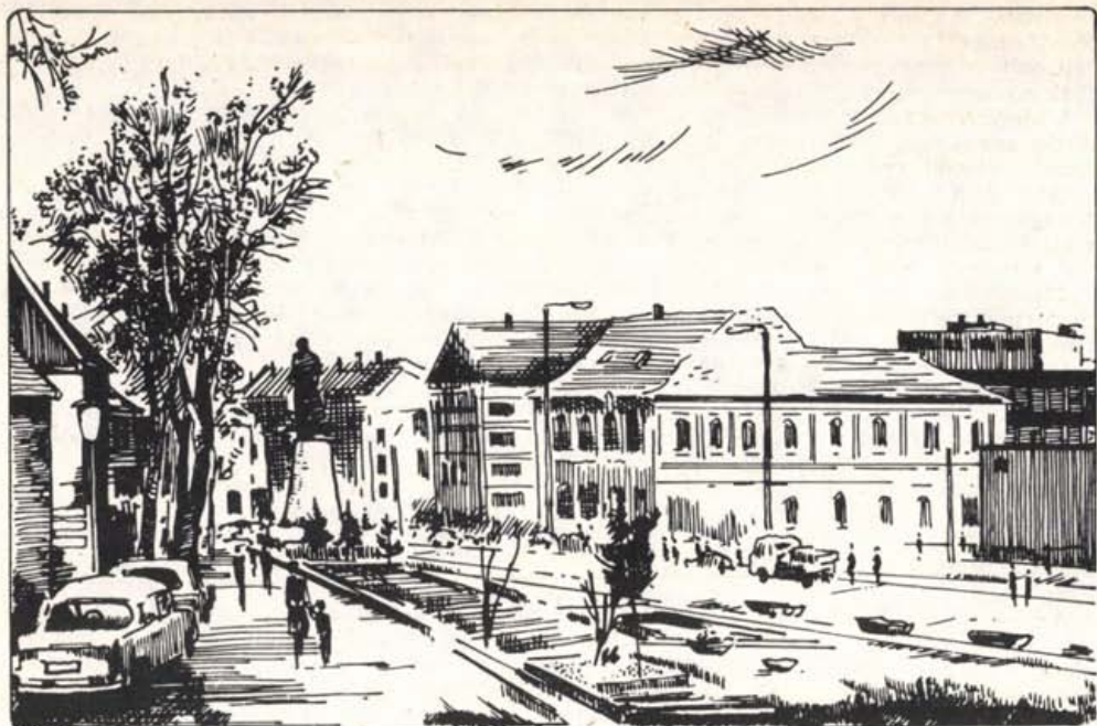
A sátorlajújhelyi vármegyeháza a Kossuth-szoborral

A darabont kormány új főispánokat nevezett ki a megyék élére, akik — amint a Sátorlajújhelyen megjelenő Felsőmagyarországi Hírlap írja — „feldűlják az egyes törvényhatóságok békéjét, lángba borítják a népszenvedélyeket és lábbal taposnak mindent, ami a haza becsületes, igazi fia szemében szent és sérthetetlen.” Egész Zemplénen végigzúdult a kormány elleni harag, különösen amikor megtudták, hogy Pallavicini Albert ögróf lett a vármegye főispánja. „Nekünk is jutott egy ezekből az önmagukról megfélemlezett díszpéldányokból” — olvashatjuk az újhelyi lapban. „Nevével egy egész korszakot fogunk elnevezni: a brutális törvénytelenység korszakát. November 17-én érkezett városunkba. Előtte, mögötte és oldalvást csendőr-csapatok kísérték... Ekkor már nagy tömeg állt a csendőrökkel megrakott vármegyeháza előtt. Ökölbe szorított kézzel nézték a vármegye szabadságának meggyalázását, és elkeseredett hangon tárgyalták az osztrák érdekekért küzdő kormány újabb törvénytiprását...”