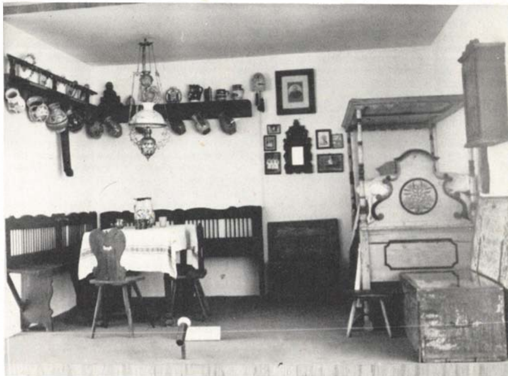
Részlet a népművészeti állandó kiállításból

A múzeum adattárában a politikai-társadalmi élet dokumentumai részben a hajdúk történetére, részben a városi élet alakulására vonatkoznak. Legrégibbek a Mohácsnál csatát veszített II. Lajos, valamint Bocskai István, Báthori Gábor, Bethlen Gábor és a különböző Habsburg királyoktól származó nemesi kiváltságlevelek. A városra vonatkozó források közül például nemrég kerültek a múzeum birtokába a Függetlenségi és 48-as Kossuth-kör, valamint a Gazdálkodó Ifjak Egyesületének, illetve a Kisgazdapárt ifjúsági tagozatának jegyzőkönyvei. A helyi gazdaságtörténet több oldalú megközelítését segítik a korabeli kéziratos feljegyzések, gazdasági naplók, céhes és ipartestületi dokumentumok. Az oktatás és művelődés, a sajtóélet s a nagy szülöttek életére, munkásságára vonatkozó iratanyag mellett igen érdekes a társas élet helyi megnyilvánulásának témaköre. Ebből itt csak az olvasókörök (alapszabály, jegyzőkönyvek,