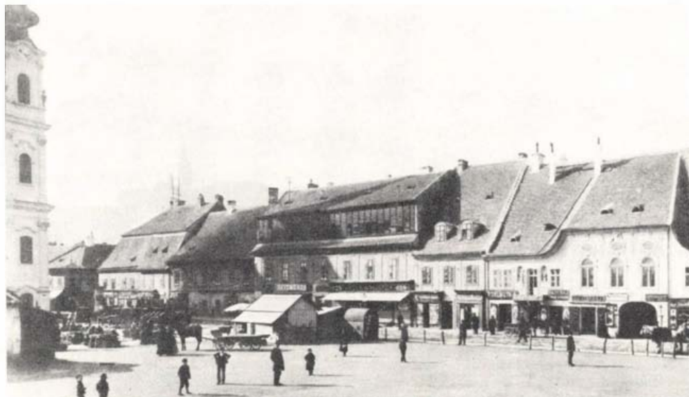
A Bomba tér (ma Batthány tér) a múlt században

A II. Budapesti Helytörténeti konferencia jelezte, hogy a mozgalomban kevés a fiatal, alig-alig akad a bizottságokban munkás. Mai felméréseink már más képet mutatnak. A főváros 22 kerületéből 19-ben működik állandóan helytörténeti bizottság: tagjaik száma 384 fő. Ebből diák, tanuló 34 fő (9%), munkás 54 fő (14%), értelmiségi 166 fő (43%), alkalmazott 130 fő (34%). Ez a korábbiakkal szemben igen jó arány és jelentős változás. Reméljük, hogy a következő években az értelmiségiek és alkalmazottak további aktív részvétele mellett, bizottságaink növelik a fiatalok számát is. Jelenleg a 30 év alattiak száma csaknem 60 fő (16%). A bizottságok tagságának többsége nyugdíjas. Van olyan kerületünk, mint pl. Zugló, ahol a bizottság csak nyugdíjasokból áll. Nem határoztuk meg korábban – s ilyen szándékunk most sincs – a bizottsági tagok számát. A legnépesebb a kőbányai: 74 tagja van, s a legkisebb a XVII. kerületi, ez csupán négytagú. A főváros területén jelenleg néhány kerületben szünetel a helytörténeti bizottságok tevékenysége. Reméljük ez csak átmenetileg van így.