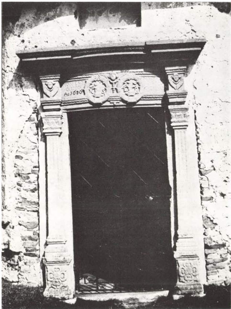
A nyugati karéjban épített kapu