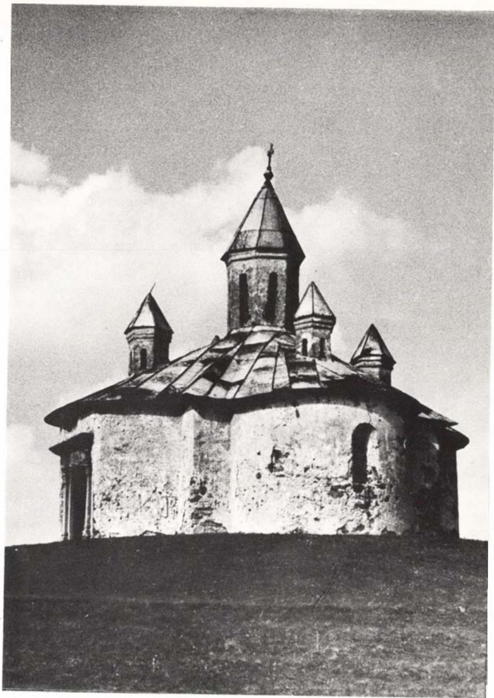
A Perkő-kápolna. Jól látható a nyugati karéjban kialakított kapu és a déli karéjban lévő ablaknyílás