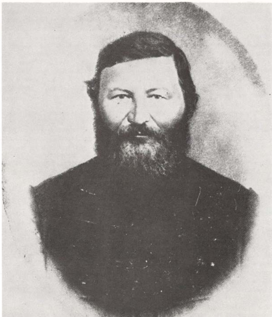
Fekete János (1817–1878) ügyvéd, Fejér megye főjegyzője, a Mik történetek a napokban című röpirat szerzője és Fejér megye Kossuth Lajos kormányzóhoz intézett hűségnyilatkozatának lejegyzője.

harc leverése után azokra a férfiakra, akik Kossuth kormányzót hűségükről biztosították és eljutottak az „éljen a köztársaság” jelszó ünnepélyes leírásáig. Az 1849 nyarán bekövetkező események kapcsán Fehérvár utcáin olvashatták a polgárok, hogy milyen súllyal szerepel a megtorlás tételei között a hűségnyilatkozat kinyomtatása.