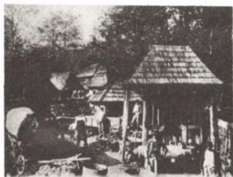
Ábrázolat Abrudbányáról Gruss aus Abrudbánya Solutère din Abrudbánya