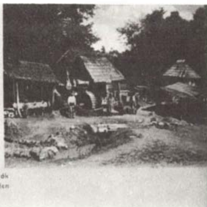
Arany Zúzó Goldstamplern