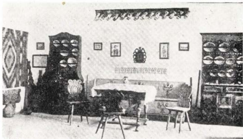
Néprajzi kiállítás az 1940-es évekből (Herepei J., 1940. I. m.)

teményeket a három nyelvű jelző cédulák révén a látogató közönség részére is nagy mértékben hozzáférhetővé tették.”