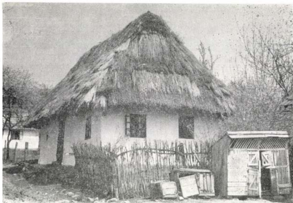
Felsővály. Nagy Gizella háza

jellegzetes alakjának a színészet, az újságírás és sok más mellett talán a szépirodalom volt a legfontosabb szenvedélye.