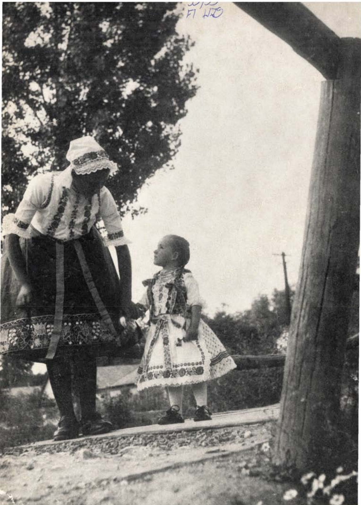
Csővári szlovák népviselet