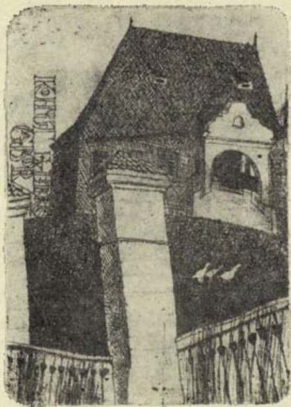
Cseh Gusztáv ex librise

A szerző a főváros legnagyobb adófizetőiről készült jegyzékeket feldolgozva foglalkozik az 1918 előtti magyar polgári társadalom nagytőkés és szerkezeti változásaival.