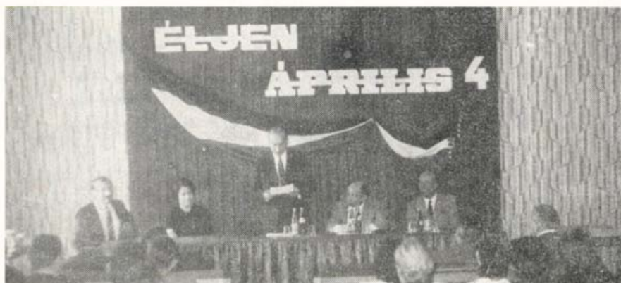
A díjkiosztó ünnepség elnöksége

A pályázatok téma szerinti megoszlása. Új és legújabb kori történelem 26; helytörténet 23; életmód 14; gyár-, ipar-, üzemtörténet 13; életrajz 8; termelőszövetkezetek története 7; oktatás, iskolatörténet 7; ifjúsági mozgalmak 3; mezőgazdaság 2; kultúra 4; egyesület- és intézménytörténet 2; brigádmozgalom, bányatörténet, színház-történet, zene, egészségügy, közigazgatás, kereskedelem egyenként 1—1 db.