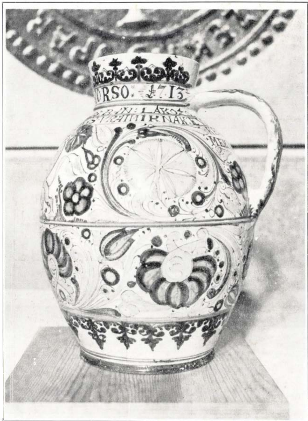
A komáromi fazekasok céhkorsója. (A komárnói Dunamenti Múzeum gyűjteményéből.)