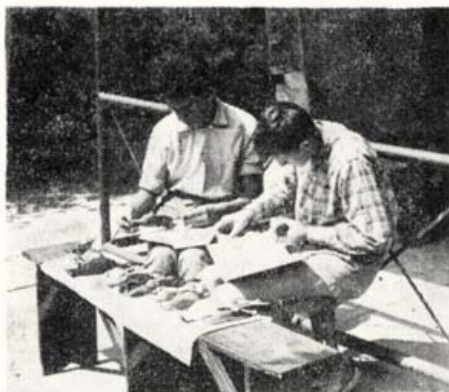
Folyik a madárhatározás

A madárvárta fő működési ideje a nyári hónapokra esik. Május és szeptember az előkészületekre, illetve a befejező munkákra megy el. A nyári hónapokban az 5–7 tagú bentlakó csoportok 10–12 naponként váltják egymást. Az itt-tartózkodásért senki semmit nem térít (villany, vezetékes víz, könyvek, folyóiratok, audiovizuális és egyéb műszerek, oktatás, csónak, strandolás ingyenes). Viszont mindenki „ön-ellátó”; ameddig a „takaró ér”. Pontos utasításokat is kapnak jöelöre: mit