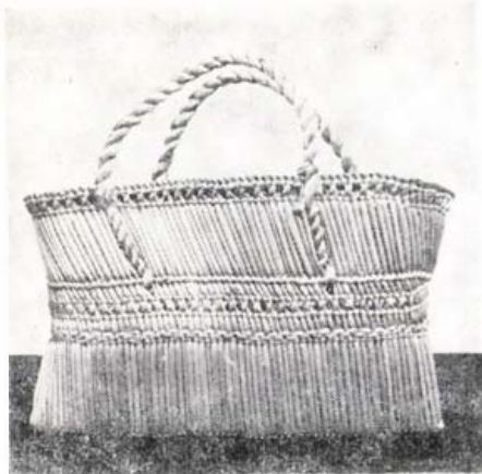
Szegaljas szatyor (Szege di Ilka, Mezőfele)

tárgyaknak az összegyűjtésére, újra elkészítésére, mert ezzel a generációval — akiknek egy része ismerte és élte még a réti életet — elfelejtődik sok szép, ősi forma, mesterségbeli fogás.”