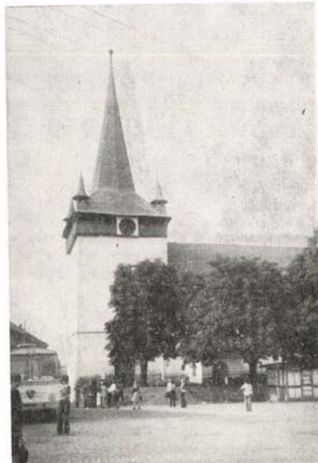
A bánffyújvárosi református templom

Kevés helye van Európának, ahol ilyen élő és sokszínű népművészetet lehetne találni. Bánffyhunyadon, Körös-főn és Magyarvistan a kalotaszegi var-