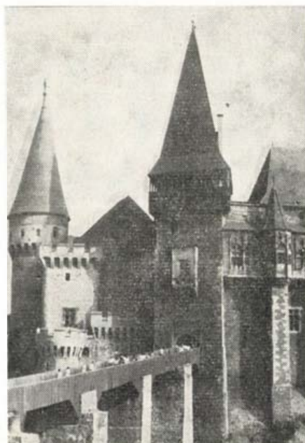
A vajdahunyadi vár bejárata

Gyulafehérváron a XIII. századbéli rk. székesegyház gyönyörű, faragott kövei, s a Hunyadi síremlékek mellett a Batthyány Könyvtárban levő arany kódex tette ránk a legnagyobb hatást. Vajdahunyadon sokáig bolyongtunk a Hunyadiak gótikus-reneszánsz várának útvesztőiben. Különösen a szépen helyreállított, csúcsíves termek tetszettek.