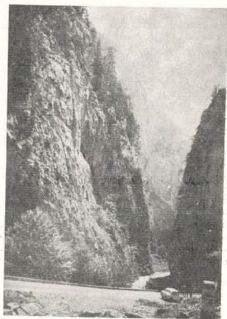
Részlet a Békás-szorosból

Szovátán a Nagy Medve-tóban a zuhogó eső ellenére sokan próbálgattuk: igaz-e, hogy nem lehet elmerülni a sós vízben? Még a tó melletti hegy csúcsán álló szószikláit is megnéztük.