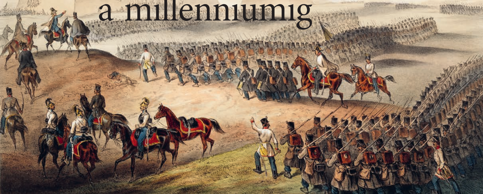
A MÁSODIK KOMÁROMI CSATA, 1849. JÚLIUS