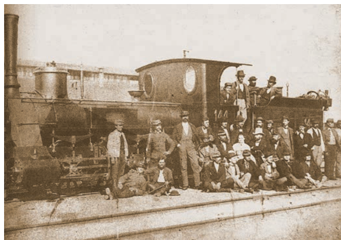
Ünnepség a hatvani állomáson a miskolci vonal 1870-es átadása alkalmából (Képek a régi magyar vasutakról és vonatokról, Közdok, 1991)

Az 1850-es évek végére még inkább nyilvánvalóvá vált, hogy megoldást kell keresni: ezt nem csupán a mind nagyobb tekin-