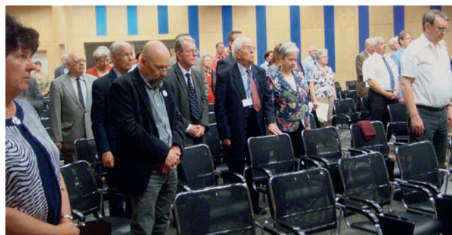
Emlékezés az elhunyt tagtársakra