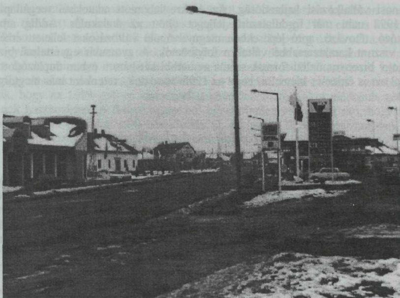
3. kép. Az új MOL-kút és a szemközti Ford autószalon a Vásártéren, a jákóhalmi útkereszteződésnél

b) Növekvő számú , de az előbbi csoporttól elmaradó növekményt produkáltak az irodák, ügynökségek és a mezőgazdasági boltok.