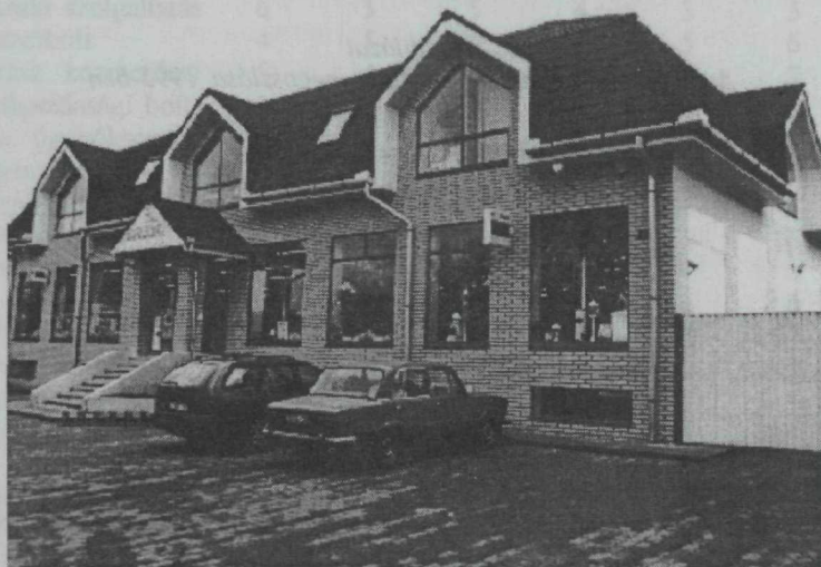
2. kép. Majdnem szemben, a túloldalon, egy vadonatúj HORIZONT műszaki üzletház

A megfigyelt egységek túlnyomó többségét 1989 előtt nem használták magáncélokra. (A magáncélok alatt valamilyen üzleti célú hasznosítást értettünk.) Több utcában szinte jelentéktelen volt az ilyen törekvés, a Dózsa György, a Szövetkezet és