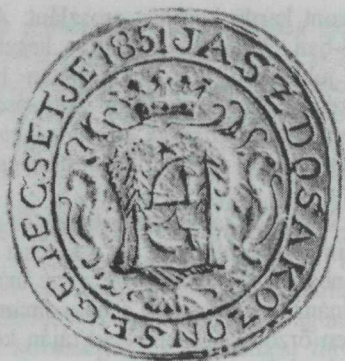
19. kép. Jászdózsa címeres pecsétje — 1851