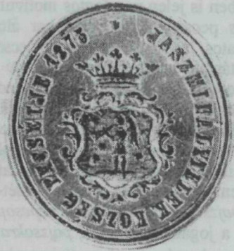
32. kép. Mihálytelek 1873. évi címeres pecsétje