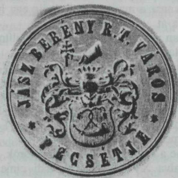
11. kép. Hivatali pecsét — 1873