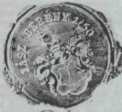
10. kép. Berényi pecsét 1850-ből