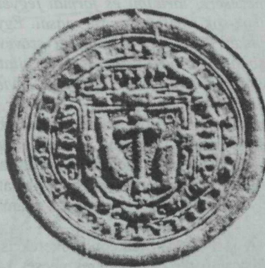
4. kép. Kürtös „régí szokott” pecsét — 1645