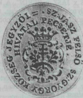
22. kép. Felsőszentgyörgyi címeres pecsét 1849-ből