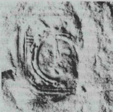
14. kép. Árokszállás címeres pecsétje 1668-ból