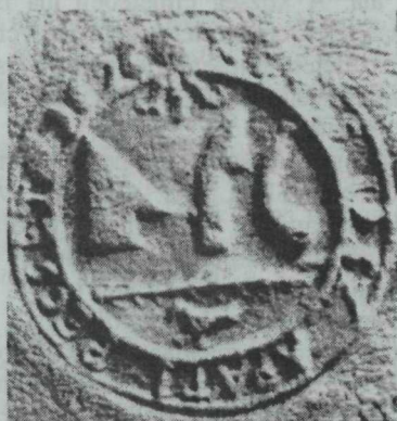
17. kép. Jászapáti 1696. évi pecsétje a kúrttel és a galambbal