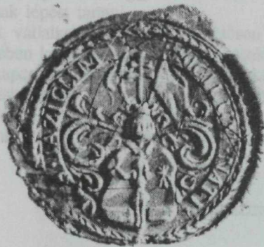
35. kép. „SIGILLUM. NATI. JAZIGUM” — 1708