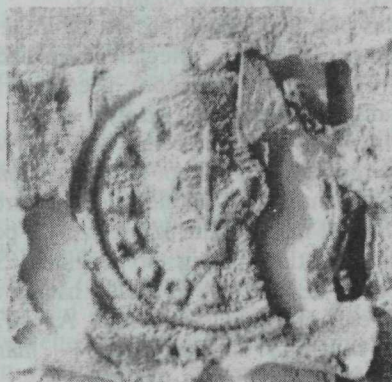
16. kép. Jászfényszaru első ismert pecsétje — 1669