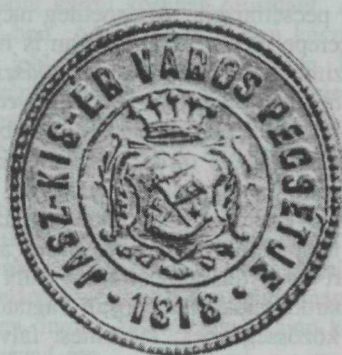
26. kép. Kisér város címeres pecsétje (kék pajzsral) — 1818