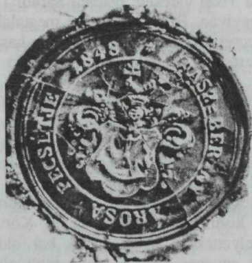
9. kép. A város 1848. évi kék pajzsú pecsétje