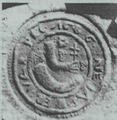
5. kép. Nemes Jászberény pajzs nélküli pecsétképe — 1688