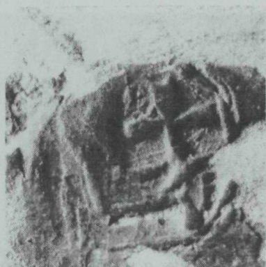
1. kép. Keresztet tartó kar 1498-ból