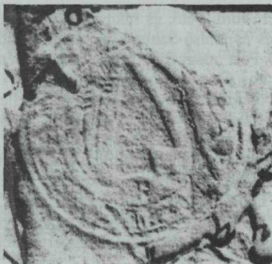
15. kép. Jászapáti pecsétnyomata —1676