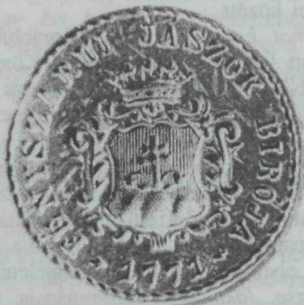
24. kép. „Fényszarui Jászok Birója — 1771.” köriratú címeres pecsét