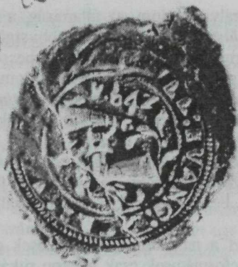
7. kép. Az Evangélikus Egyház sigilluma 1642-ből