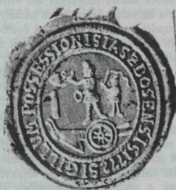
18. kép. Jászdózsai pecsétkép 1699-ből és 1772-ből