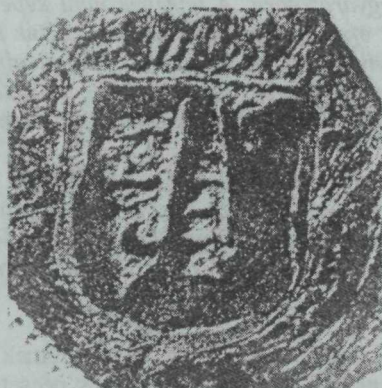
3. kép. Jászberény-Magyarváros sigilluma — 1560