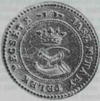
31. kép. JászMHálytelek 1772 és 1868 között használt pecsétje