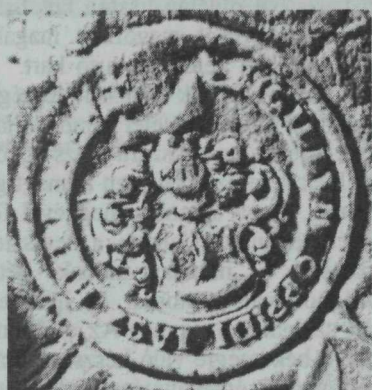
6. kép. A mai címer első, 1699. évi előfordulása