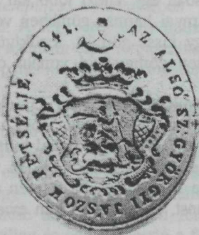
21. kép. „Az Alsó Sz. Györgyi Jászok” pecsétje — 1841