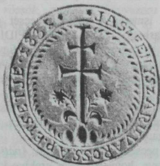
23. kép. Jászfényszaru városi sigilluma 1670. évi pecsétképpel