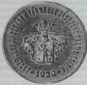
34. kép. Jákóhalma község 1928-ban megújított címeres pecsétje