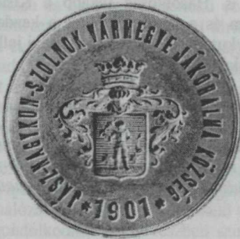
33. kép. Jákóhalma 1901. évi címeres pecsétje, 1767-es motívumokkal