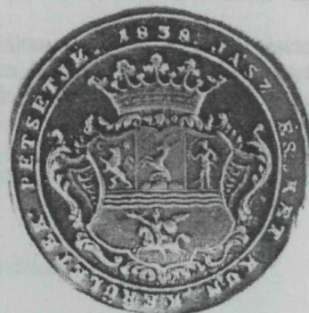
36. kép. A JászKun Kerületek 1838. évi megújított címeres pecsétje