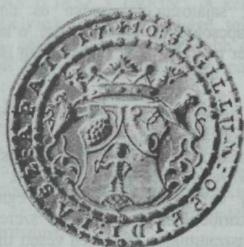
27. kép. Jászapáti első városi sigilluma — 1750