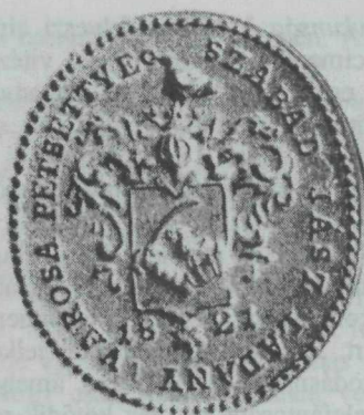
20. kép. „Szabad Jász Ladány város pecsétje — 1821”