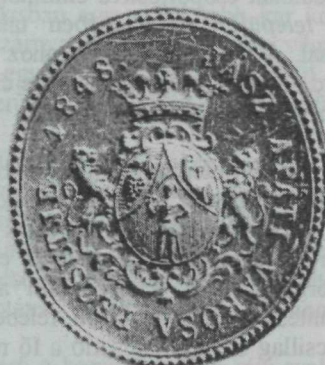
28. kép. Apáti címeres pecsét — 1848