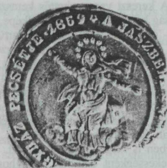
8. kép. A berényi Katolikus Egyház pecsétje 1859-ből