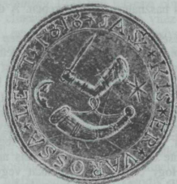
25. kép. Jászkiséri városi pecsét 1818-ból, 1670. évi motívumokkal