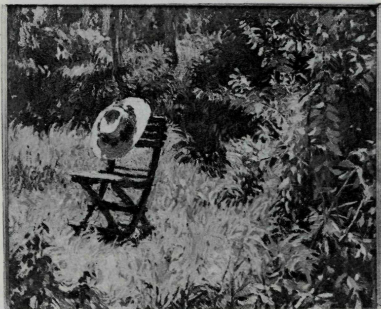
Nyilasy Sándor: Napsütés c. festménye

Az Alföld tája és népe több kiváló magyar festőt meghihletett. Soraikból különösen három dél-alföldi művész magaslik ki. Egyik a Szentese-környéki szegényparasztság nyomorát és lázadó indulatát drámai erővel ábrázoló Kosztai József (1864–1949), másik a vásárhelyi Tornyai János (1869–1936), aki a nehéz, keserves zsellérmunka színterét, a Viharsarok vidékét és népének társadalmi viszonyait kritikai élel mutatta be. Harmadik, a kettejük eszmei és művészi örökségét leginkább megértő, s azt felhasználó Kohán György (1910–1966) volt.