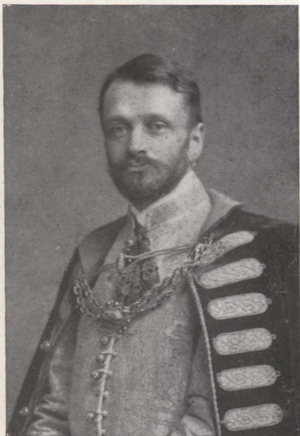
Csíkszentkirályi és krasznahorkai gróf ANDRÁSSY GYULA, m. kir. belügyminister.