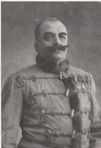
Jekel- és margitfalvi JEKELFALUSSY LAJOS, táborszernagy a szolgálaton kívüli viszonyban, m. kir. honvédelmi miníster.