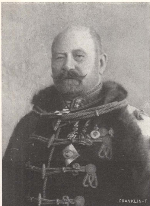
BIHAR FERENCZ, altábornagy a szolgálaton kívüli viszonyban, m. kir. honvédelmi minister.