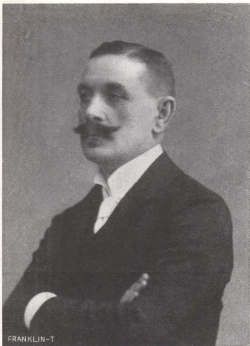
Csejthei KRISTÓFFY JÓZSEF, m. kir. belügyminister.