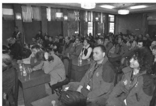
A megnyitó közönsége