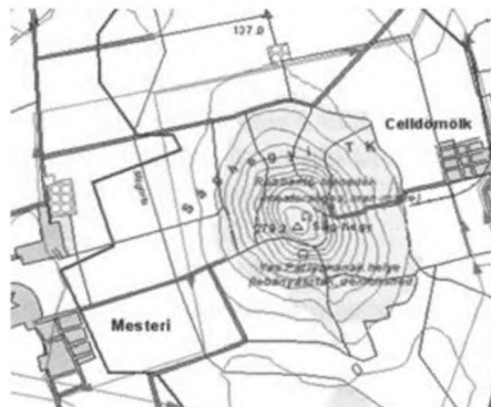
4. ábra. A Vas Pál lyukának feltételezett helye