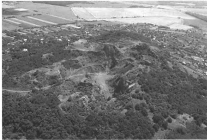
1. ábra. A Ság lebányászott felső része madártávlatból

Nem került el a bányászat a kisebb testvért, a Kis-Somlyót sem, de ugyancsak kőfejtők működtek a sitkei Herceg-hegyen, a gércei és miskei dombokon is. Ezek azonban jóval kisebbek voltak, nem okoztak olyan látványos tájrombolást, bár némelyikük egészen a közelmúltig használatban volt.