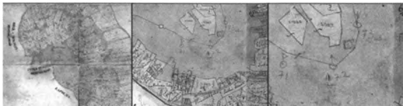
3. ábra. A Ságüreg jelkulcsi jelölése a Ság-hegy 1857-ben készített kataszteri szelvényén (forrás: Arcanum Adatbázis Kft.: Vas megye az első kataszteri felmérés térképein 1856–1860)

alátámasztott megállapítás, hogy a Vas Pál lyukának nevezett barlang valóban a Ság-hegy déli oldalában volt, és nem pedig annak fensíkszerű tetején.