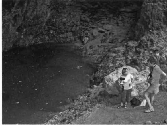
A Vaucluse-forrás kisvízi időszakban

Másnap, búcsút mondva a levendulaillatú Provancenak, átköltöttünk a francia Grand Canyonnak nevezett Ardeche-folyó szurdokának bejáratánál található újabb hároméjszakai bázisunkra. Útközben három újabb idegenforgalmi barlangot fűztünk fel a gyűjteményünkbe. Az elsőként felkeresett Cocalière-barlang látványai már szinte említésre sem méltóak az Orgnac-zsombolyban látott újabb palacsinta-sztalagmitok mellett. A barlanglátogatás után felkerestük a közelben berendezett prehistorikus múzeumot is, amely főleg az ugyancsak a közelben feltárt Chauvet-barlang leleteit mutatta be. A látványokra a koronát mégis a Forestière-barlang aragonit- és kalcitkristályai tették fel. Sajnos az él-