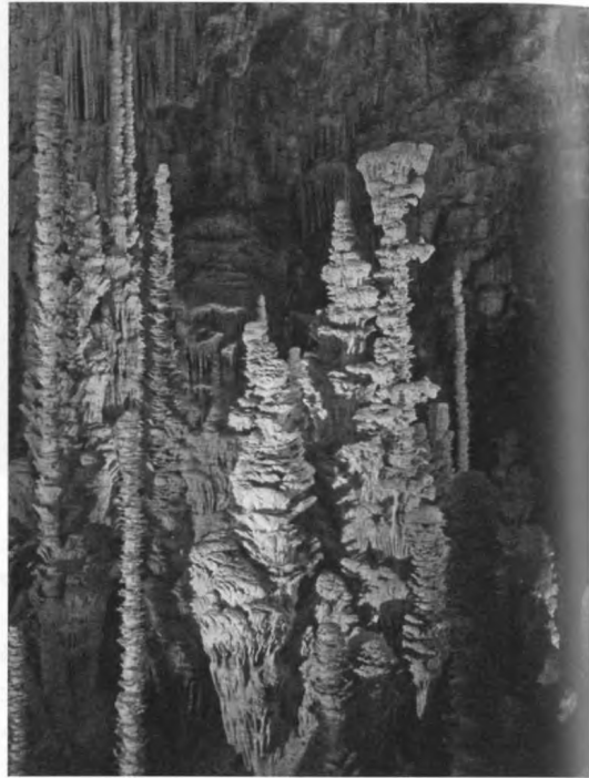
A dél-franciaországi Aven Armand cseppkőcsodái