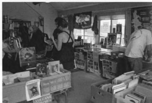
A rendkívül gazdag szakirodalmi kínálat

Szerencsére hazai és nem francia nyelvterületen, bolt és mellékhelyiség, valamint esetleges füves sátorozóhely közelségében a társaság nem is nagyon vette szívére az eseményt. Végül azonban sikerült megjavíttatni a járművet, s így tartottuk magunkat a már szokásos késői hazaéréshez.