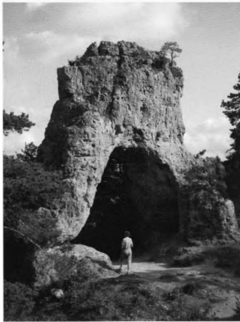
A Montpellier de Vieux nevezetes sziklakapuja

ményeket rendkívüli mértékben csökkentette a magát ugyancsak barlangkutatóként minősítő helyi túravezető, aki szinte hisztériás rohamokat kapott, amikor közelebbről és az engedélyezettnél hosszabb ideig próbáltunk gyönyörködni a mind színükben, mind formájukban rendkívül változatos képződményekben.