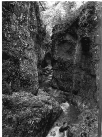
Az Ördög-szurdok részlete

Vasárnap délelőtt már csak pár órás zágrábi városnézésre volt alkalom, s máris elrepült a négy nap.