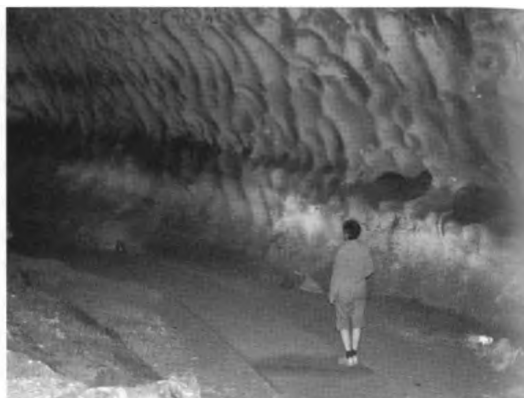
Barlangrajz és gyönyörű oldásformák a Saint Marcel-barlang falain