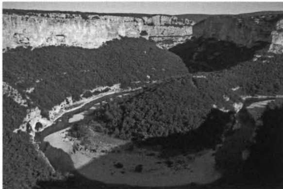
Az Ardeche-folyó szurdoka

Sajnos a következő nap nem verőfényes napsütéssel kezdődött, s az időjárásjelentés is esős időt jelzett. Kétféle táv között lehetett választani: egy rövidebb, 6 km-es és egy hosszú, 30 km-es túrát. Mindkettő esetében busszal szállították vissza a résztvevőket a kiindulási helyre. Kétszemélyes csónakokban, mentőmellénnyel felszerelve, a társaság nagyobb része a hosszú túrára indult. Szerencsére a kezdeti kellemetlen, esős idő a nap második felére elmúlt, legalább ezzel nem tetézve a társaság szenvedéseit. Néhány hajó kivételével mindenki