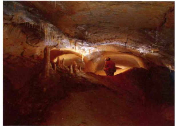
Képek a Pál-völgyi-barlang újonnan felfedezett Jubileumi-szakaszából