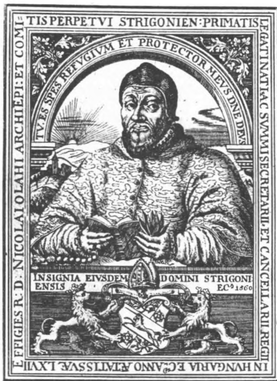
1. ábra. Oláh Miklós arcképe és címere (Hübschmann Donát rézmetszete, 1560)

Oláh Miklós Hungaria című, latin nyelvű művének a szerző által saját kezűleg javított kézirat kódexét Bécsben az Osztrák Nemzeti Könyvtár kéziratára őrzi Cod. lat. 8739, saec. XVI. jelzet