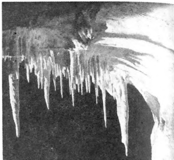
Hajnóczy-barlangban eredeti szépségükben tündökölnek a Nagy-terem sztalaktitjai

a hazai törekvéseket, bemutatja a külföldi természetvédelem formáit és helyeit, a rezervációra ajánlott hazai területeket és külön fejezetet szentel az egyes magukban álló természeti emlékeknek. „Az egymagukban álló természeti emlékek közé kell sorolnunk a föld felületén csak a bejáró nyílásaikkal jelentkező és a külszínen ez okokból területileg körül nem határolt, a tudományos kutatásra azonban fölöttébb nagy értékű, vagy turisztikai szempontból elbíraltan érdekes és látványos barlangokat is, melyek a természeti emlékek között kétségkívül elsőrendű szerepre tarthatnak számot, ha nem is szólunk arról, hogy azok egyike-másika idegenforgalmi tekintetben is nagy jelentőségű.” A barlangokkal, „mivel azok nagy tudományos jelentőségét kevesen ismerik”, behatóbban foglalkozik, kiemeli nemzetközi jelentőségüket is. Könyvében 42 oldalt szentelt az akkori 32 legjelentősebb barlang hegységenkénti ismertetésére. Kaán Károly rámutatott hazánknak a természetvédelem területén levő elmaradottságára. Sürgősnek és nélkülözhetetlennek tartotta a természetvédelmi törvény megalkotását, melyre javaslatát a könyvben meg is tette. A barlangok védelmének rendjéről azonban sem a barlangok ismertetésénél, sem a természetvédelmi törvényalkotás tervezeténél nem tett említést.