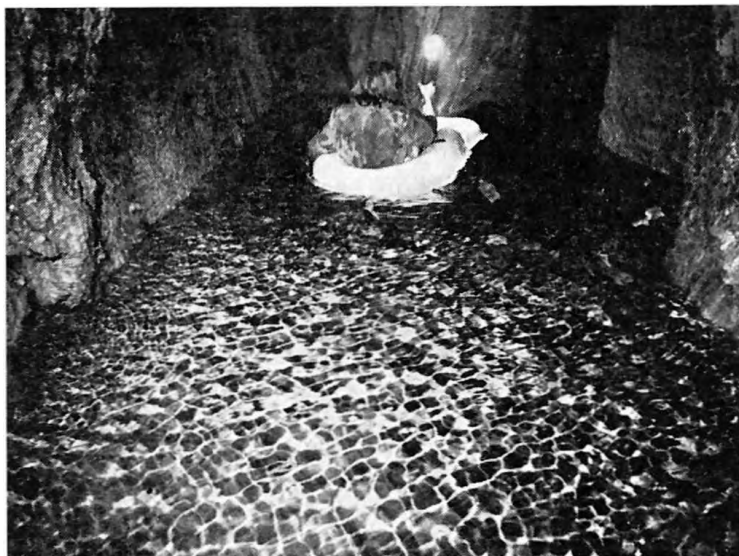
A Kossuth-barlang belsejét maga a természet védi a hivatalos látogatóktól