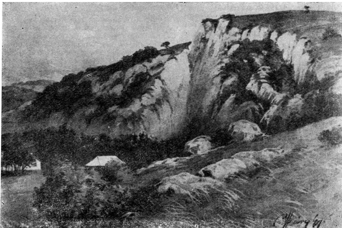
A Baradla-barlang bejáratának környéke 1870. táján. Hány Gyula eredeti vízfestménye után. (A Magyar Nemzeti Múzeum tulajdona).

„... Ragályi Gedeon úr, írja, Gömör vármegye vice nótáriusa (vármegyei aljegyző)... maga kocsiján és költségein elvitt Agtelekre, a híres Baradla nevű barlangnak megvizsgálására. Ez a barlang... egy csupa kőből álló hegynek öblében (fekszik). A barlang szája esik egy 27 \frac{1}{2} ölnyi meredek kősziklanak az alján, mely kőszikla... úgy áll, mint az egyenes kőfal... Az alján levő lyukba gugyorodva kell bemenni, és ez az alacsony, de széles torkolat mintegy fél fertály óráig tart, amikor az ember a valószínűs barlangba bejut, melynek boltozatjához képest a nagy templom magossága és tágassága nem is hasonlítható. A kövek úgy csüngenek alá az ember feje felett, mintha mindjárt nyakába szakadnának; a hang rémitő módon zeng e tágas öblben, löttünk egynehányat és a legszörnyűbb mennydörgés kicsiny volt a puska ropogásához. Fáklyákkal vezettek két vezetőink, kik egyedül az utazók behordozásából élnek; fáklyát nagy öllel vittünk be, mert ha ebből a vándorló kifogyna, soha a barlangból melynek még végét senki össze nem járta, ki nem jöhetne. Ága a lyuknak sok van; mi délig egyet, délután másikat jártunk be; a többire nem értünk. Voltunk mindössze kilencen. Elindultunk tehát az első ágán, és találtunk csepegő kövekre, s az azokból