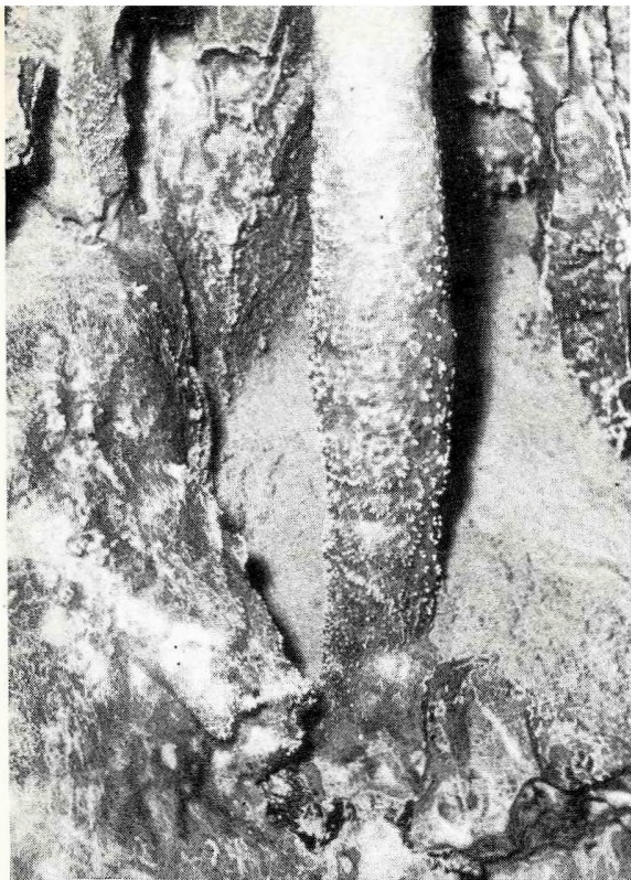
Diszozslop. Részlet a Létrástetői-barlang keleti ágából.