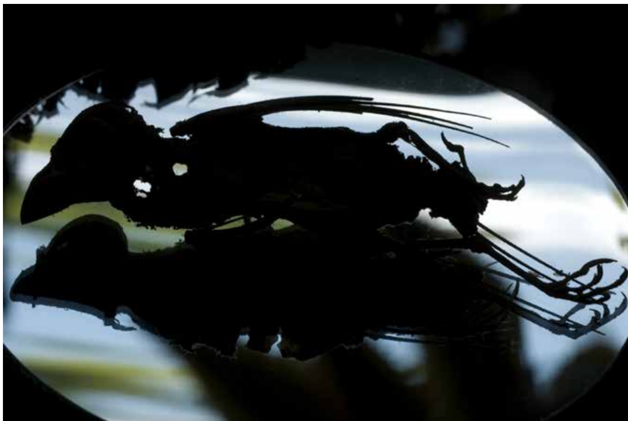
Horváth M. Judit: Csalóka látszat , Budapest, 2009, digitális technika © Horváth M. Judit