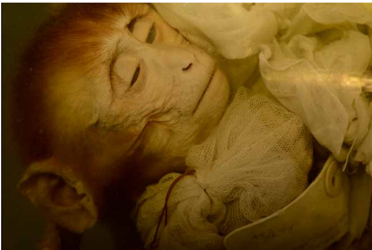
Horváth M. Judit: Magángyűjtemény , Budapest, 2018, digitális technika © Horváth M. Judit