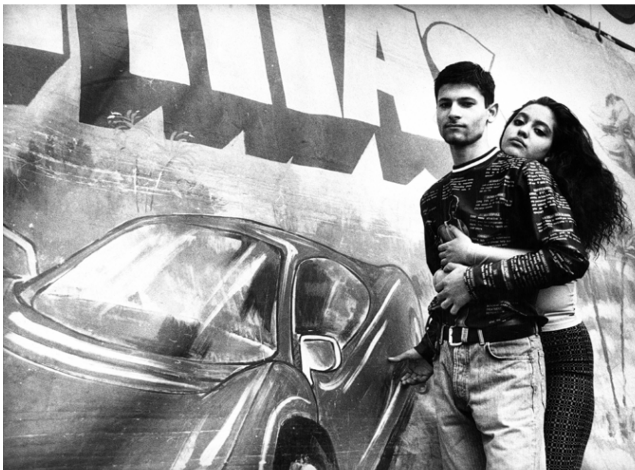
Horváth M. Judit: Más Világ, Budapest , 1997, analóg technika

T. O.: Mikor találtad meg magad és a szereped fotográfusként?