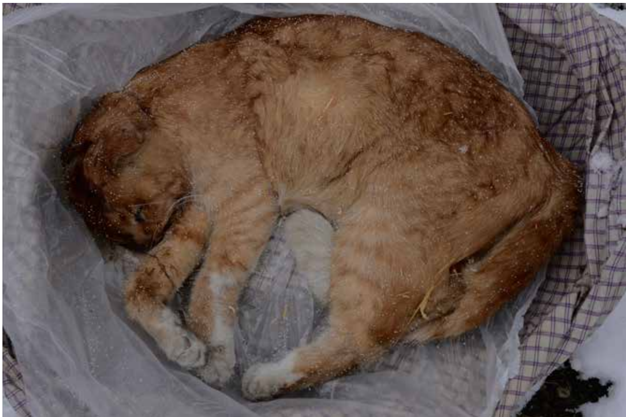
Horváth M. Judit: Magánygyűjtemény, Budapest, 2018 , digitális technika

Már gyerekként is egész közel mentem az elhullott állatokhoz, hogy megnézhessem, mennyire mások közléről. Érdekel a halál, a megváltoztathatatlan, és az ezzel való szembesülés. A sorozat készítése egyfajta gyászmunka volt, amely során igyekeztem kifejezni a szeretteim elvesztése felett érzett fájdalmamat.