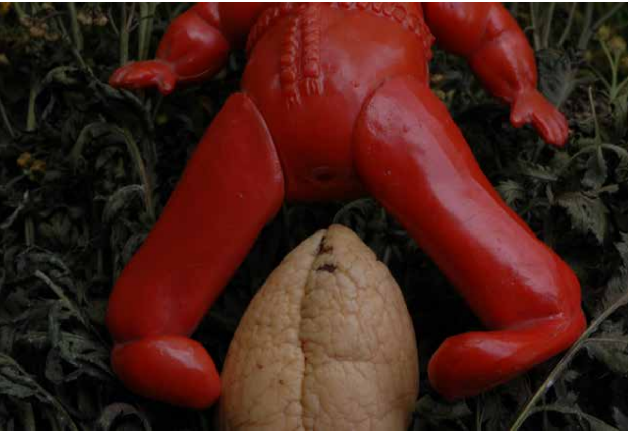
Horváth M. Judit: Csalóka látszat , Budapest, 2009, digitális technika © Horváth M. Judit