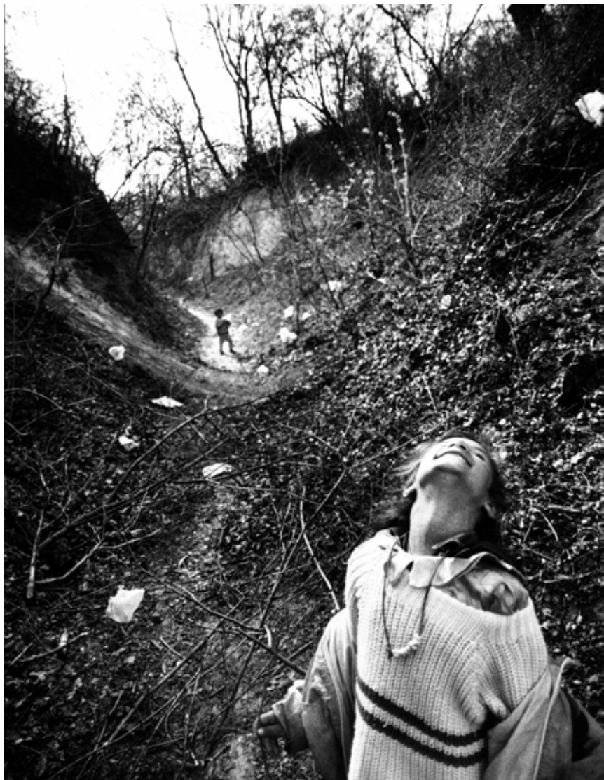
Horváth M. Judit: Más Világ, Bogács , 1996, analóg technika

HISZ A SZABAD GONDOLKODÁSBAN, A VÉLEMÉNYNYILVÁNÍTÁS SZABADSÁGÁBAN, DE LEGALÁBB ENNYIRE FONTOSNAK TARTJA AZ ELFOGADÁST IS. LÉTELEME A MOZGÁS, AZ ÁLLANDÓ VÁLTOZÁS. ÚGY VÉLI, HA NEM TÖRTÉNIK SEMMI, AZ OLYAN, MINT A HALÁL, AMELYNEK KÖZELSÉGÉT MÁR MEGTAPASZTALTA. MÉGSEM HAJLANDÓ FÉLELEMBEN, TABUK ÉS KORLÁTOK KÖZÉ SZORÍTVÁ ÉLNI. HA SZÜKSÉGES, MÉG PROVOKÁL IS. MÁR FIATAL LÁNYKÉNT IS ILYEN VOLT: POLGÁRPUKKASZTÓ ÉS NAGYSZÁJÚ. HORVÁTH M. JUDIT A TÁRSADALOM KÉPMUTATÁSÁRÓL, A FOTÓZÁSRÓL, MINT TERÁPIÁRÓL, SZERELEMRŐL, ÉS A MESÉKRŐL, AMELYEK A MENEKÜLÉST JELENTIK A VALÓSÁGBÓL.