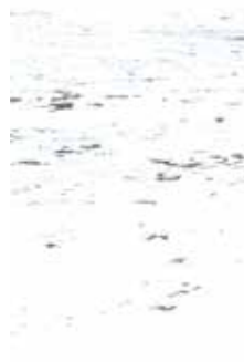
Kerekes Emőke: Kék remorka , 2023. február, Archiv injejt print, 40x50cm

Kerekes Emőke kérdésfelvetése tulajdonképpen egyszerű. Arra kíváncsi, miként változott meg a földhöz való viszonya annak az embernek, aki a földet megműveli. Kérdezhetné ezt itt Magyarországon is, legalább olyan tanulságos lenne, mint úgy, hogy Erdélyben teszi. Valószínűleg sok részletében különböznének a válaszok, de az alaprétégük mégis hasonló. A tájhoz, a földhöz és a természethez való viszonyunk ambivalens, összetett, és minden racionalitás látszat ellenére, mélységesen irracionális lett.