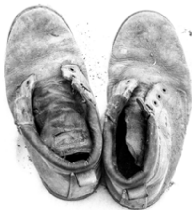
Kerekes Emőke: Törbúza , 2021. február, Archív injekt print, 40x50cm © Kerekes Emőke