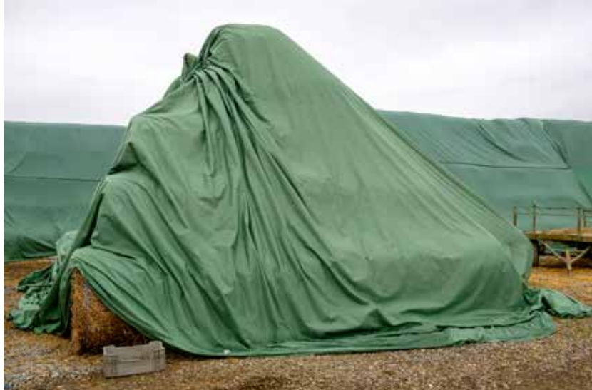
Kerekes Emőke: Zöld ponyvák , 2022. december, Digitális print, 20x30cm © Kerekes Emőke Kerekes Emőke: Torta bála , 2021. december, digitális print Banner anyagon, 102x126 cm © Kerekes Emőke