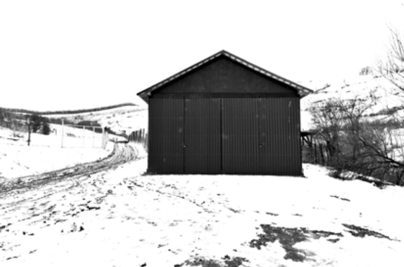
Kerekes Emőke: Csónakház , 2021. március, Digitális print, 13x18cm