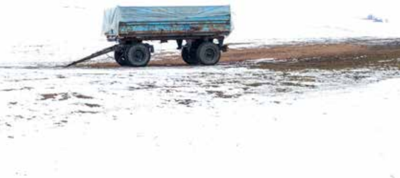
Kerekes Emőke: Torta bála , 2021. december, digitális print Banner anyagon, 102x126 cm © Kerekes Emőke