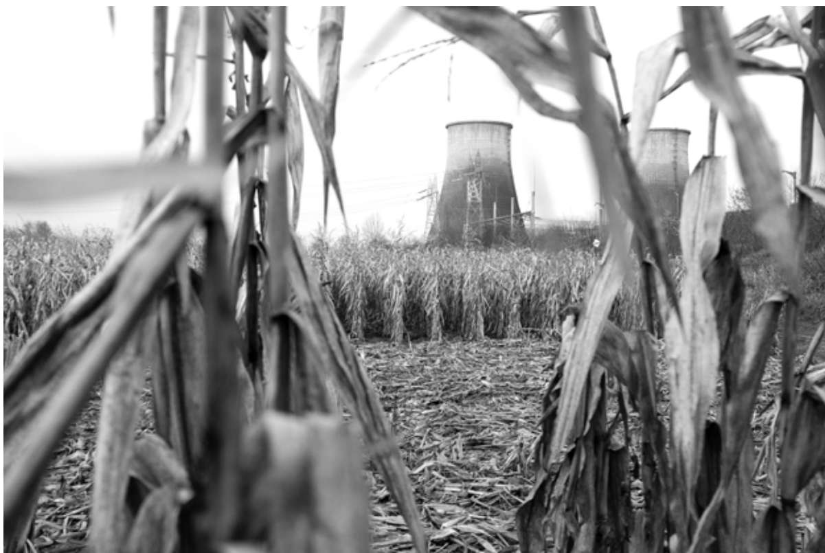
Kerekes Emőke: Üzem , 2022. december, Archív injekt print, 26x40 cm