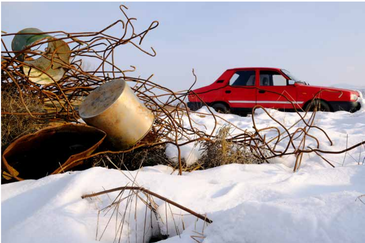
Kerekes Emőke: A Vasba , 2023, február, Digitális print, 20x30 cm © Kerekes Emőke

Sokat eszembe jut, hogy vajon tudunk-e, képesek vagyunk-e szimbólumok és metaforák nélkül gondolkodni. Az a véleményem, hogy nem. Csupán korlátozni, elfojtani tudjuk magunkban a hétköznapi dolgok átértelmezését. Persze, mióta ráébredtünk, hogy a világ varázstalanítva lett, van valamiféle benyomásunk arról is, hogy nehezebben férünk hozzá a jelképeinkhez, ezáltal valószínűleg nehezebben is fejezzük ki magunkat. Kevésbé tragikus megközelítésben: másként. Mert kétségtelenül vannak új szimbólumaink, még ha egyelőre nem is látjuk olyan világosan, használjuk ezeket, sokszor anélkül, hogy tudatosítanánk a szimbolikus jelentőségüket.