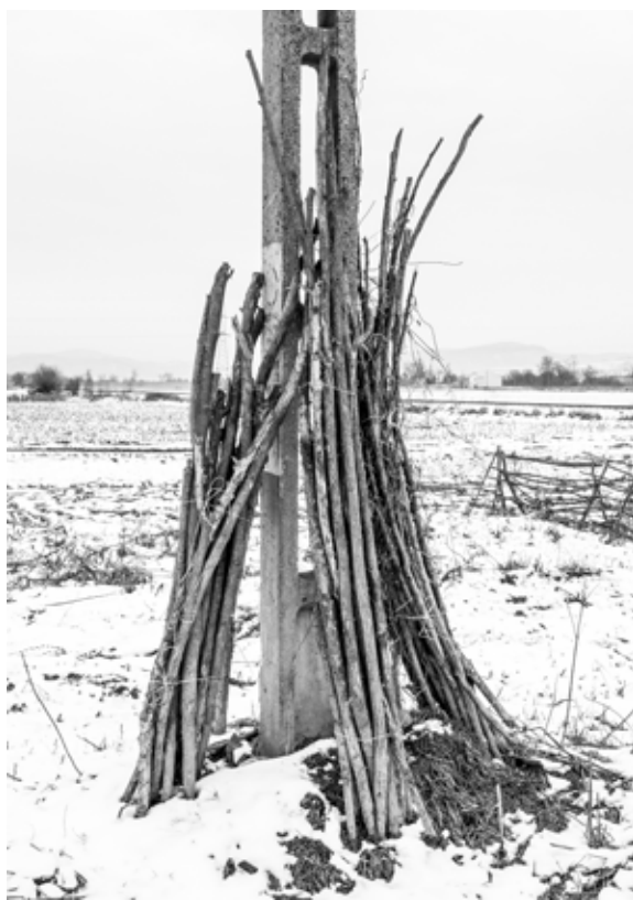
Kerekes Emőke: Paradicsom karók , 2021. február, Archív injekt print, 50x70cm © Kerekes Emőke