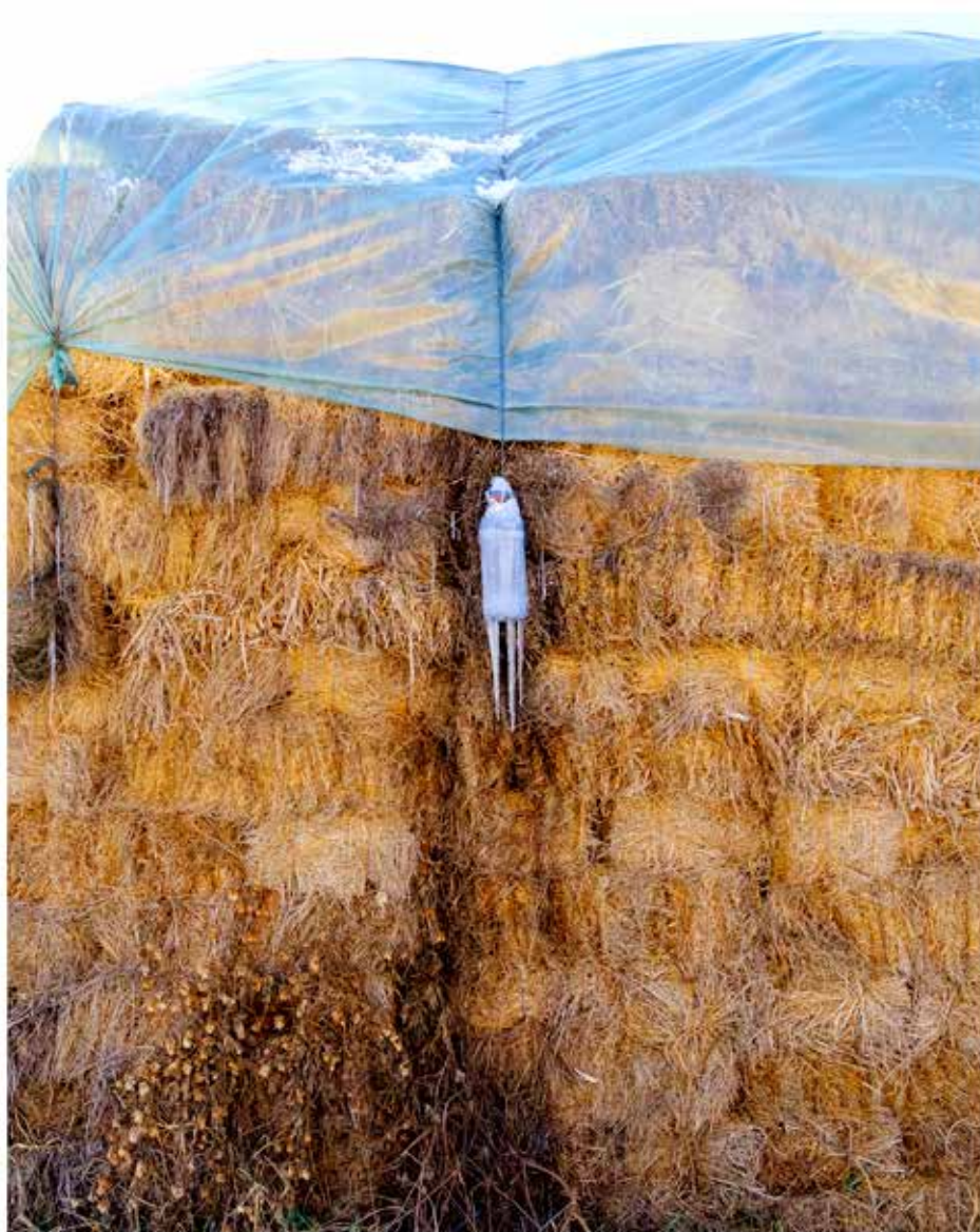
Kerekes Emőke: Angyal , 2022. január, Digitális print Banner anyagon, 102x126 cm © Kerekes Emőke