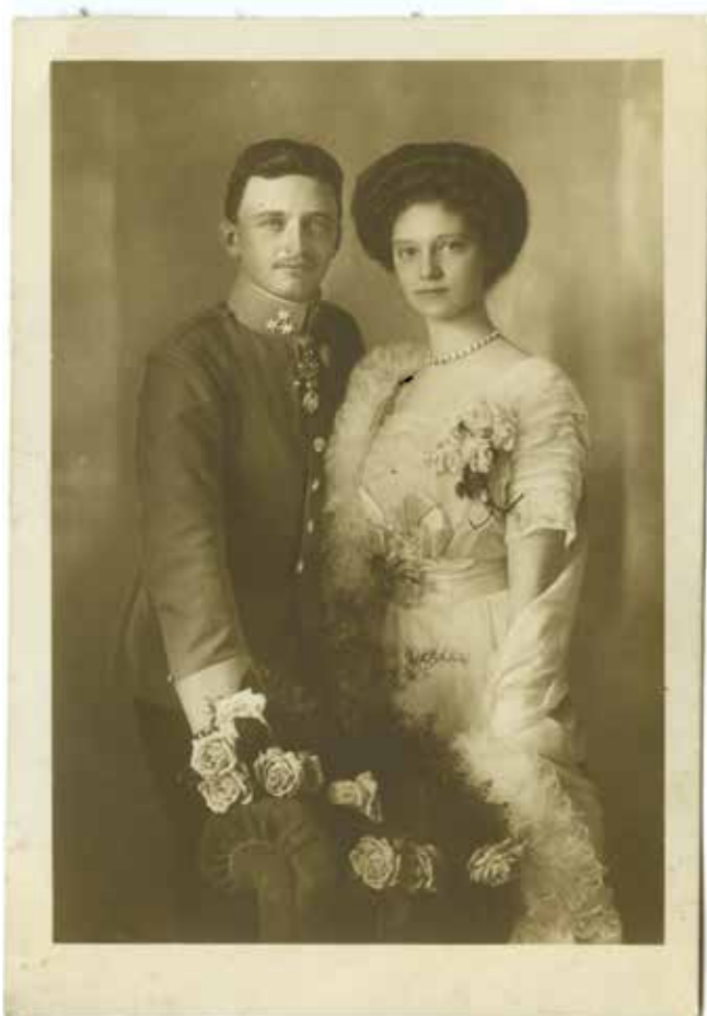
Carl Pietzner: IV. Károly (1887–1922) király és Zita királyné (1892–1989), 1911, eljegyzési fénykép