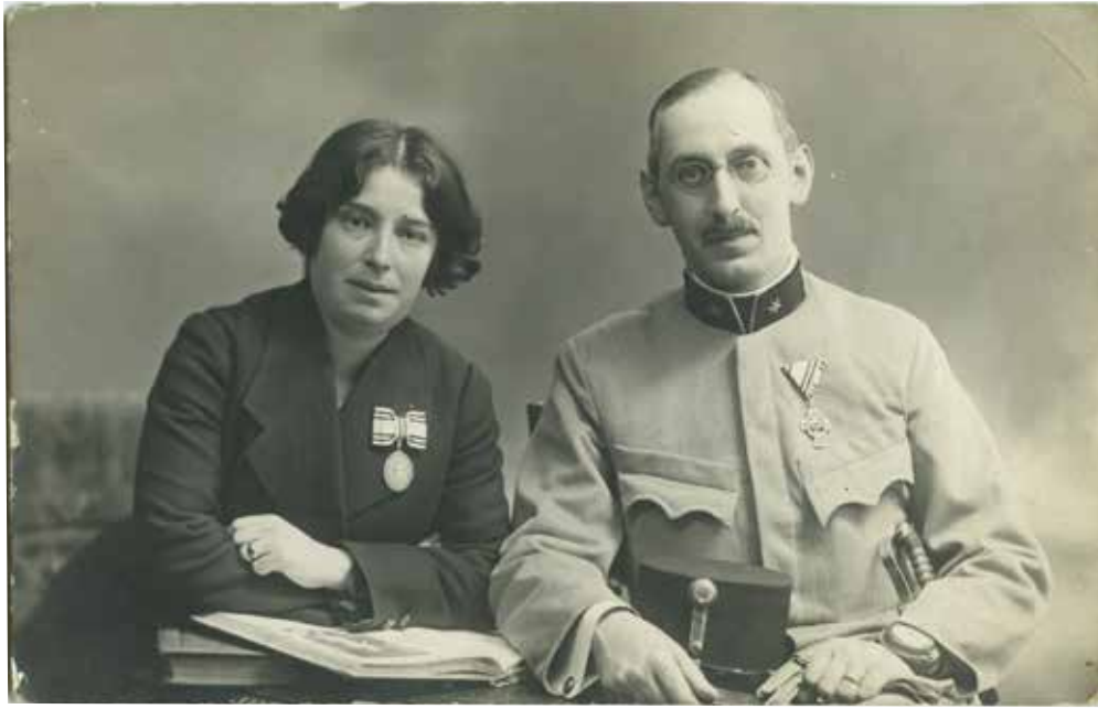
Pár, mindkettőn Vörös Kereszt kitüntetéssel, 1914 után