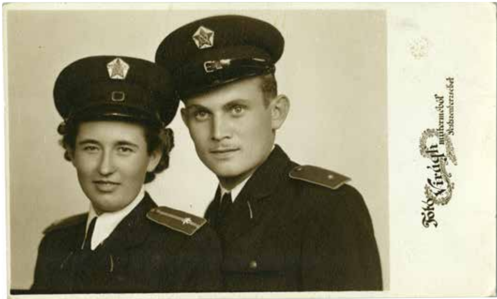
Virágh műterem: Egyenruhás pár esküvői képe, 1950 © A szerző gyűjteményéből

Első világháborús beállítás az egymás mellett ülő egyenruhás férfi és sötétruhás nő kettőse. A levelezőlap méretű másolaton a hölgy egyértelműen a férfi felé dől ültében. (Talán készült egy közelebbi beállítás is, ahol fontosabb szerepet játszott a fejtávolság.) Mindkettőn kitüntetés viselnek ruhájukon, a hölgy az Osztrák Vöröskereszt Díszjelményét, melynek felirata: „ Patriae ac Humaniti ” (a hazáért és az emberiségért). A férfi egyenruháján szintén a Díszjelményt látjuk, de a tiszti keresztet, a hadi díszítmennyel. Ezt a kitüntetés-típust Ferenc József alapította 1914. augusztus 17-én, a fénykép tehát ez után a dátum után készült. Feltűnő még az is, hogy mindkét szereplő