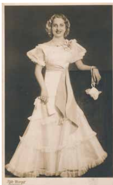
Ismeretlen bálozó nő portréja , 1930-as évek, levelezőlap