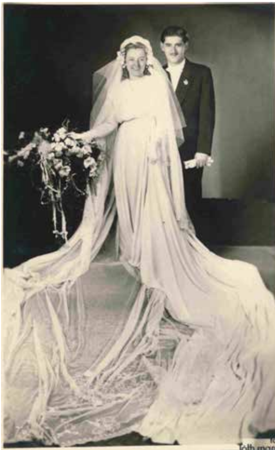
Ismeretlen pár portréja, 1940-es évek, levelezőlap, a szerző tulajdona Ismeretlen pár portréja, 1940. IX. 19. felirattal, levelezőlap, a szerző tulajdona