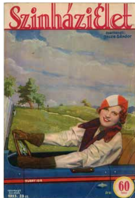
Turay Ida színésznő portréja, 1933, Színházi Élet, 1933/23., borító

A Fotográfusnők konferencia 1 óta jobban figyelünk a női alkotókra, kérdés, hogy vajon ki, mikor találja meg az ízlésének megfelelő művészt. Különleges női életutak bőven akadnak, sejtelmes és érthetetlen eltűnések még inkább. 2 Nemrégiben egy professzionális női mesterre bukkantunk az esküvői képek gyűjtögetése közben. Tóth Margitnak az 1940-es években készített ünnepi műtermi képein olyan világítási effektusokra, elrendezési manőverekre figyelhettünk fel, amelyek messze felülmúlják az átlagos pesti portréfényképészek munkáit. Kompozícióján jól megfigyelhető a gép működésének ismerete, a tanultság, a nagy szakmai rutin, a retusálási manőverezés negatívban és pozitívban. A fényképésznő élete és művei látszólag közel vannak hozzánk, hiszen most dobják a szemétkébe az általa készített nagytáblásokat, amelyek olyan embereket ábrázolnak, akik az elmúlt évtizedekben haltak meg.