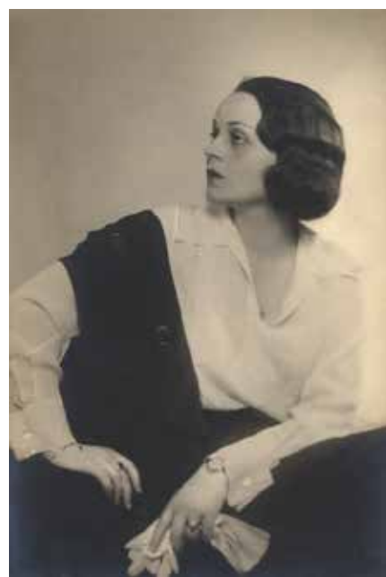
Sulyok Mária portréja, 1931, zselatinos ezüst, 12x8 cm OSZMI Ltsz.: 2014.146.1.