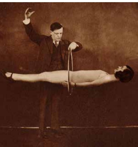
Karinthy Frigyes író bűvészkedik , 1929, Színházi Élet 1929/6., 63.