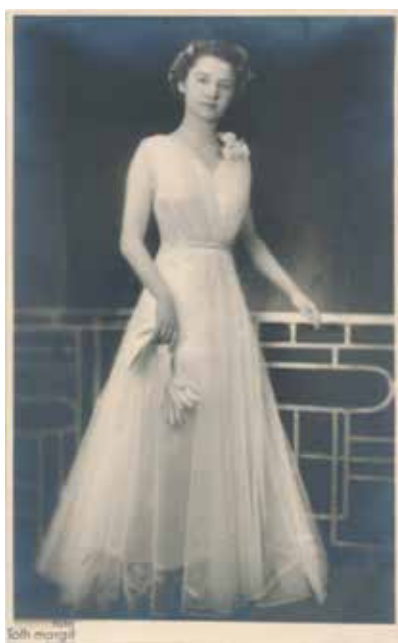
Ismeretlen bálozó nő portréja , Budapest, 1938. február 26. levelezőlap, a szerző tulajdona