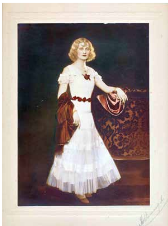
Ilon portréja , 1940-es évek 23,5x17 cm, a szerző tulajdona

„Hogy a pályázást megkönnyítsük, megállapodunk Halmi Béla (IV. Kecskeméti u. 19.) és Tóth Margit (IV. Petőfi S. u 2.) fényképészekkel, akik bál ruhás pályázatunkra a mi költségünkön (a pályázóknak ingyenesen) készítik el lapunk számára a legművészebb felvételeket.” 24 A Miss Magyarország címért is versengtek a nők, egészen a Miss Európa szépségversenyig. A lap montázsai helyett három eredeti képpel illusztráljuk a művésznő ilyen tevékenységét. Fekete-fehér, barnított és egy színezett példányon mutatjuk be ezt a rutinos oldalt, melyek a korabeli divatfényképezést is reprezentálják.