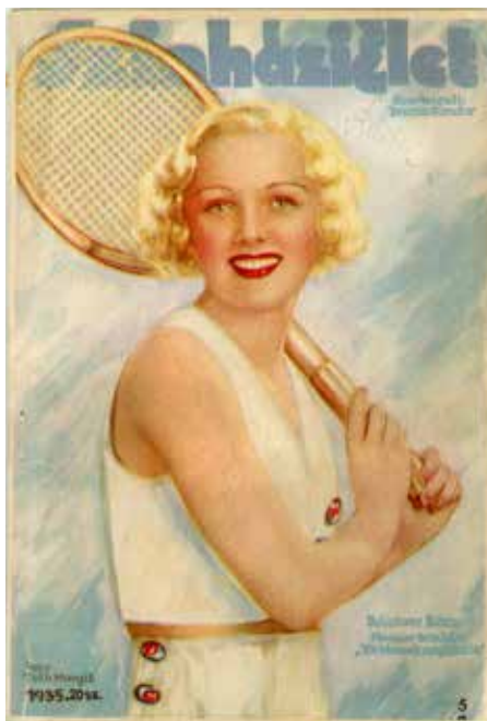
Bársony Rózi színésznő portréja, 1935, Színházi Élet, 1935/20., borító