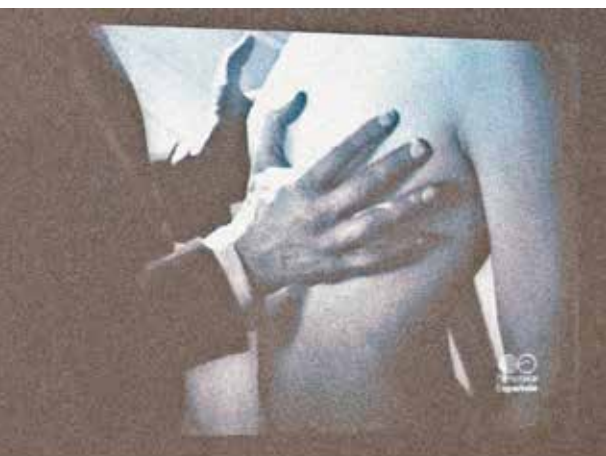
I'm thinking of you more on Tuesdays

Több képén is érezhető, hogy női alkotóval állunk szemben, egy nő szeme van a fényképezőgép mögött. Ennek a kiállításnak a hangulatát elteszem az emlékezés cipős dobozába, hogy alkalomadtán elővehessem, akár régen a képeslapokat.