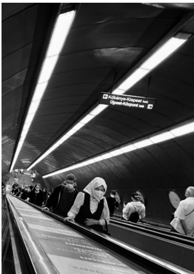
Cedric af Geijersstam: Metro-Spective Moszkva Tér – Maszkos Néni (Széll Kálmán tér, Budapest), 2020

A street photo műfaji jellegzetességeinek megfelelően Geijersstam kedvelt témái köztéren ellopott pillanatok, tömegközlekedésben résztvevők, buszon, villamoson utazók szokásos helyzetei: üvegfelületen keresztül látvány, hátulról láttatott emberek, tükröződések, árnyékok, véletlen vizuális együttállások vagy oppozíciók. A szokatlanul magas vagy alacsony nézőpontból fotózott, környezetükkel együtt, esetleg ellenfényben bemutatott tárgyak és emberek arra adnak lehetőséget, hogy elbizonytalanítsák térérzékelésünket, a síkok megdőlnék, kimozdulnak. A centrális perspektívával ellentétben nem a valós tér illúziójává, hanem síkokból összeálló kompozícióvá alakítják a városi látványt, melyhez sokszor csak megfelelő – szokatlan – nézőpontot kell kiválasztania az utcafotósnak. Cedric is így tett, amikor a metró mozgólépcsőjének tetejéről fotózta a közlekedőket ( Moszkva tér – Maszkos néni , 2020). Az extrém alul- vagy fölülnézet alkalmazását Moholy-Nagy Lászlótól és Alexandr Rodcsenkótól ismerjük, akik ezt a kedvelt módszert – a képzőművészeti konstruktivizmus megoldásainak megfelelően – az átlókra épített kompozíció létrehozásának érdekében alkalmazták.