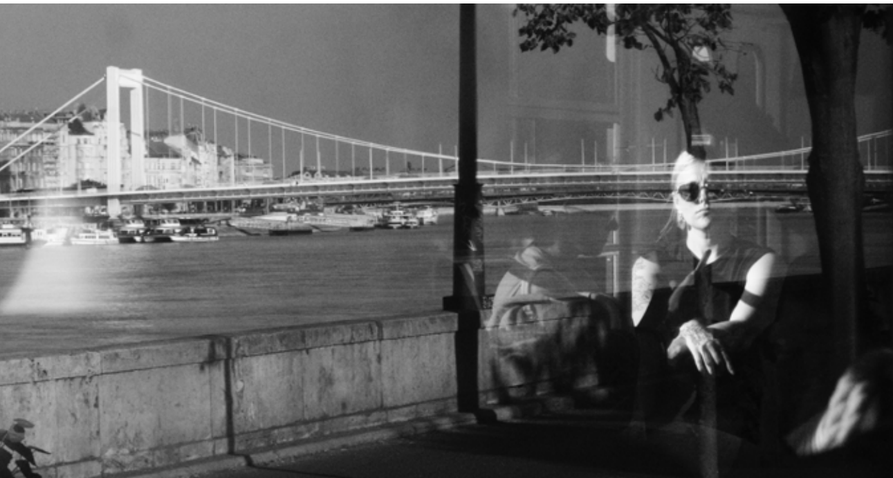
Cedric af Geijersstam: Elizabéth – Egy lány tükröződése a villamoson , 2021

Cedric af Geijersstam svéd és magyar szülők gyermeke, 1994-ben született Stockholmban. Nagy-Britanniában folytatott tanulmányai és megszerzett diplomája után a Magyar Újságírók Országos Szövetségénél tanult fotózni, 2022-ben a Főfotó Galériában, Budapesten volt egyéni kiállítása. Gyerekként sok időt töltött Budapesten, és az urbánus lét, a heterogén várostapasztalat nyújtja fotóinak alapélményét ma is. Geijersstam azonban nem egyetlen koncepció, vagy csupán valamilyen koncepció mentén fotózza a várost és lakóit, hanem megtalált, érdekesnek tűnő részletek, csoportok, látképek egyesülnek monokróm fotográfiáiban. Analóg és digitális fotóin a főszereplő az ember – városi környezetben. Más szavakkal: fő témája az ember urbánus mindennapjai. Hogy ezekre a helyzetekre ráleljen, és fotografikus kompozícióvá tegye őket az avantgárd fotó és a street photo hagyományát, a banális helyzeteket fotózó Stephen Shore látásmódját követi. A fiatal alkotó fotói könnyed, fiatalos világot tükröznek, némi kellemes retró érzéssel; vasaló nője például a nyolcvanas évek Budapestjére emlékeztet. Talán ennek az is az oka, hogy a digitális fordulat és a CGI fotóművészetre gyakorolt hatását felismerve, és arra reflektálva Cedric af Geijersstam inkább az analóg