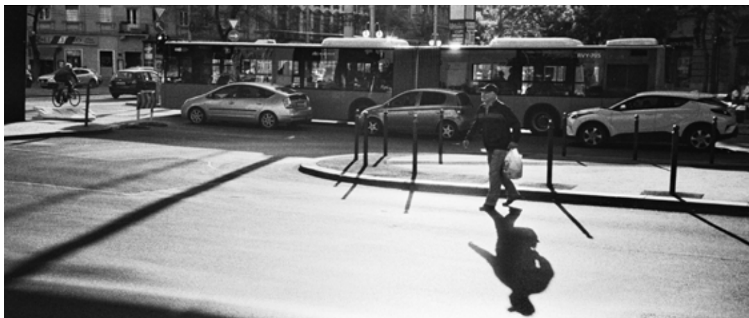
Cedric af Geijerstam: Férfi árnyékkal, amint átkel az úttesten , 2021