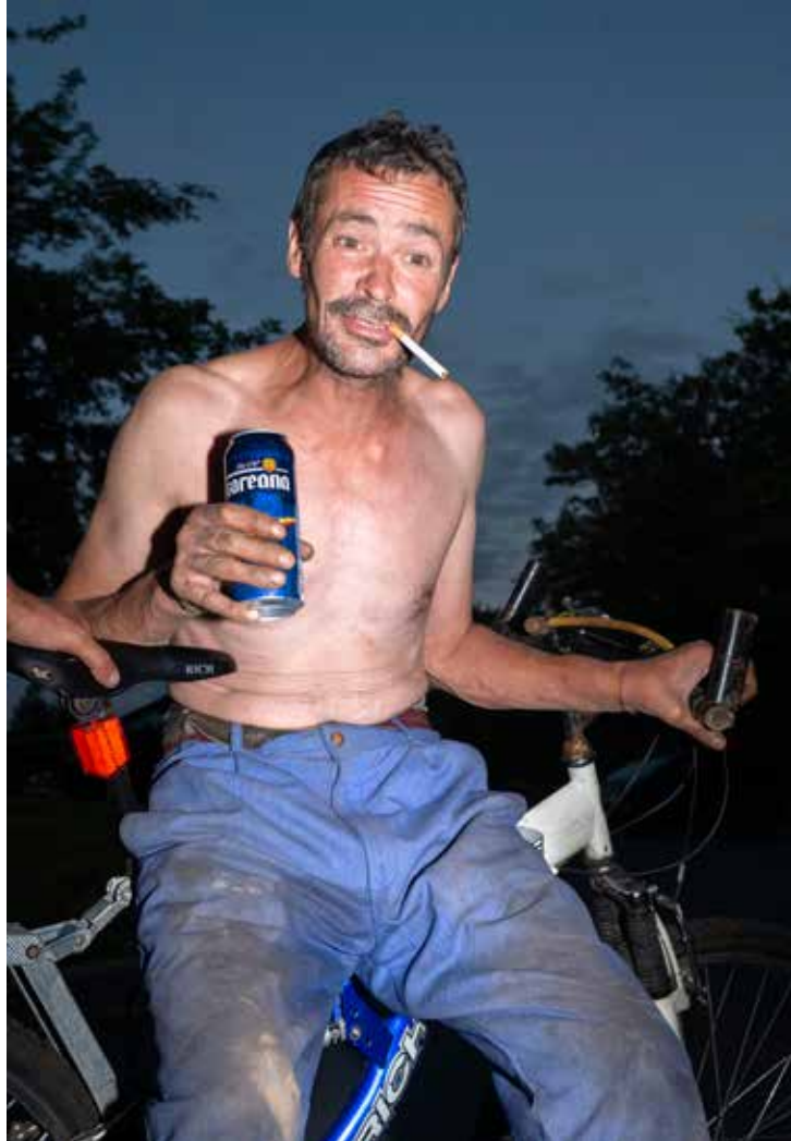
Sivák Zsófia: Áraink forintban értendők #17 , 2019 © Zsófia Sivák