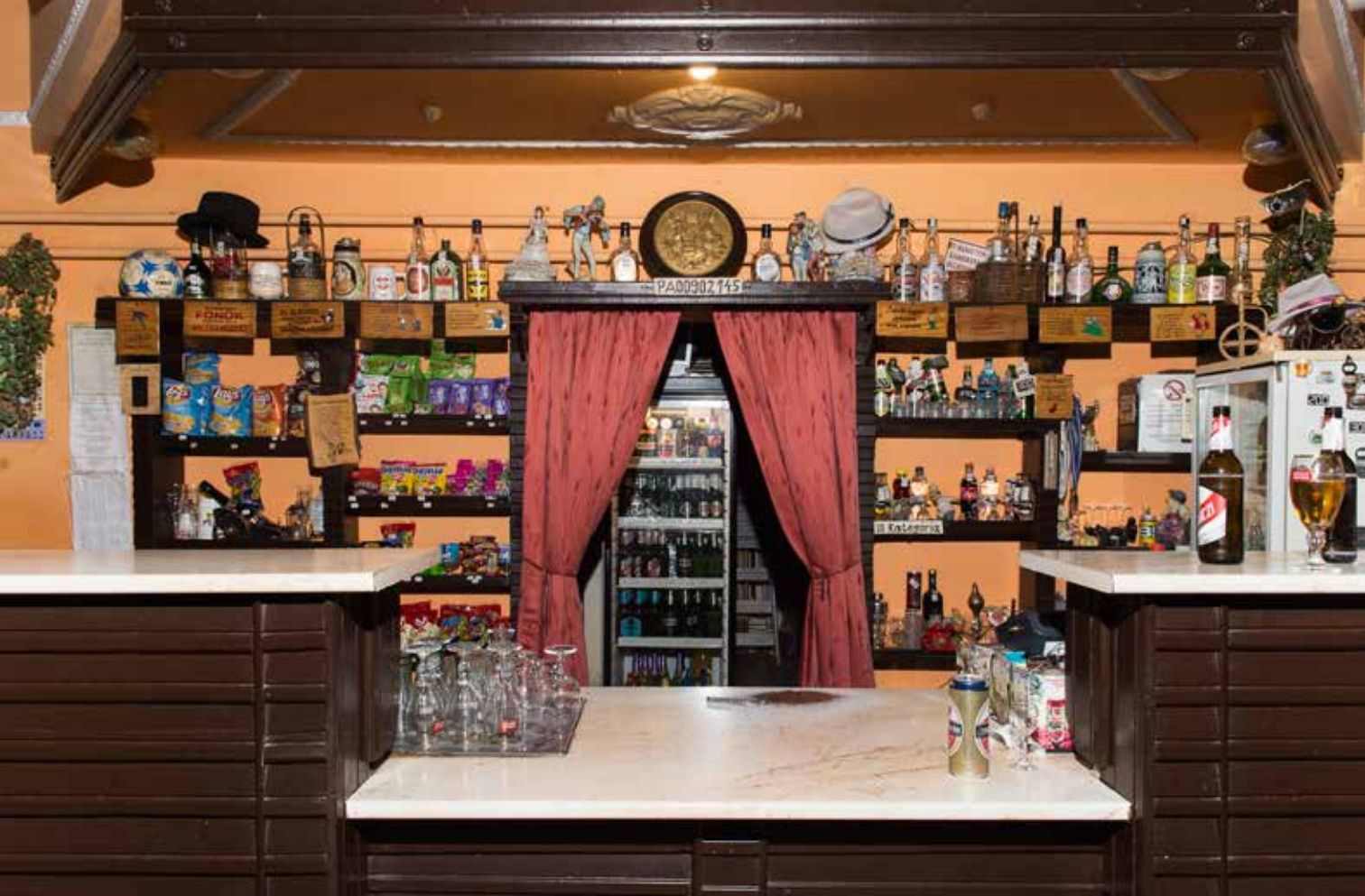
Sivák Zsófia: Áraink forintban értendők #18 , 2019

A sorozat képein egyszerre van jelen humor, az irónia, a kihűlt terek kegyetlen látványa, és ami ennél is fontosabb, Sivák Zsófi azt is megmutatja, hogy akik délutánonként összegyűlnek a Heves megyei kocsmákban, pontosan tudják, hogy ők az utolsók. A gyerekeik már vagy elköltöztek, vagy nem arra a közösségi hálóra vágnak, amely annak idején egy kocsmában létrejöhetett. A kocsmában, amely a templommal és a bolttal együtt a közösségi információáramlás helyszíne volt.