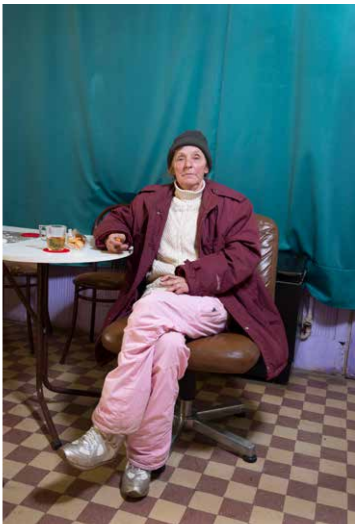
Sivák Zsófia: Áraink forintban értendők #13 , 2019 © Zsófia Sivák