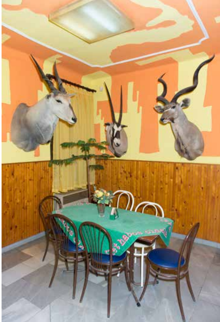
Sivák Zsófia: Áraink forintban értendők #4 , 2019 © Zsófia Sivák