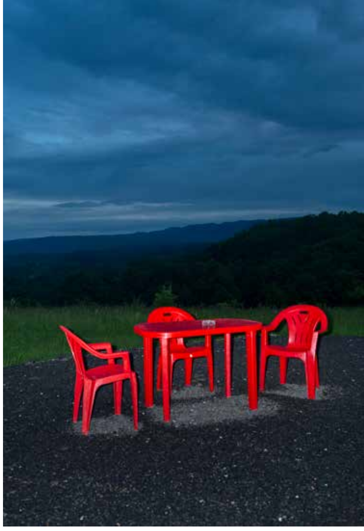
Sivák Zsófia: Áraink forintban értendők #16 , 2019