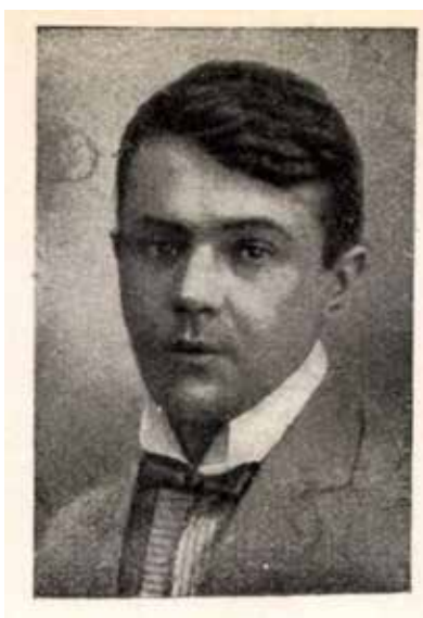
Kosztolányi Dezső Nyugatban megjelent portréja