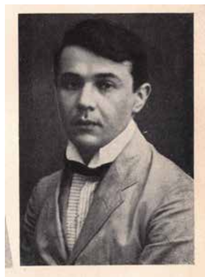
Kosztolányi Dezső portréja a Pesti Hírlap Vasárnapjában

ban többször is, a Kosztolányira emlékező írások és kiadványok illusztrációjaként. Kosztolányinének a férjéről írott könyvét először folytatásokban közölték a Pesti Hírlap Vasárnapjában , itt a hatodik közleményben kapott helyet, 2 majd amikor a visszaemlékezést a könyvhétre könyv alakban is kiadták, természetesen abban is megjelent. 3 Ehhez képest, amikor a Nyugat közölte a fotót, 4 mintha egy másik képet látnánk. Ezen mások a fények, és mintha felvételnél a fényképezőgép egy magasabb pozícióban lett volna. A két exponálás között változott Kosztolányi szájartása, és a fejét is kissé elfordította, ezért itt látszik a jobb fülének részlete. Mindez pedig azt jelenti, hogy Székely nem egy, hanem több felvételt készített egyazon alkalommal Kosztolányiról. Minimum kettőt.