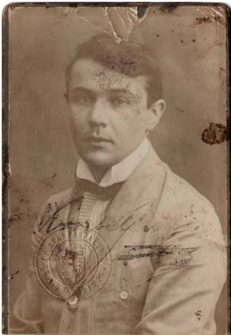
Székely Aladár: Kosztolányi Dezső portréja , 1908, bal alsó sarokban a CS. K. SZAB. DÉLI VASPÁLYA TÁRSASÁG szárazbélyegzője

Van Kosztolányinak egy többször reprodukált fiatakkori portréja, amelynek nem ismertük a készítőjét. Székely Aladár pedig remek portrékat, köztük íróportrékat is készített – csak eddig nem tudtuk, hogy Kosztolányiról is. Sőt, úgy hírelt, hogy róla éppen hogy nem készített. Most azonban egy elveszettnek hitt pozitív kópia előkerülésével egymás mellé kerültek a szórványos információk, és összeállt a kép.