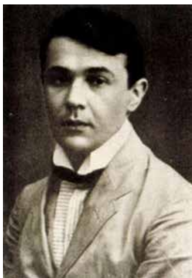
Székely Aladár: Kosztolányi Dezső portréja , kivágat