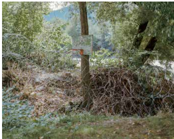
Végh László: Kosárlabda palánk szögesdróttal Kárpátalján a Tisza partján az ukrán-román határnál. A két országot a Tisza választja el. © Végh László

Végh László folyamatban lévő Tisza fotóanyagát megismerve és a motiváció kérdéseit kutatva, arra jutottunk, hogy egy belső érzés munkálkodik benne, a gyerekkori élmények, érzések megtalálásának és felidézésének vágya hajtja. Mit is jelent számára ez a folyó, miért vált ki belőle ma is mély hatást? Tehát nem egy szigorúan vett konceptuális fotóanyagról van szó, inkább egy érzelmi utazás lenyomatait láthatjuk a képek által. Bár ez egy alakuló és befejezetlen anyag jelen pillanatban, már most is van néhány olyan felvétel, amely sarokpontként szolgál, és amelyről már az elkészülés pillanatában érezhető volt, hogy meghatározó helye lesz a sorozatban. Ilyen a Tisza kárpátaljai szakaszán fotózott szögesdróttal körbevett kosárpalánk képe a folyó ukrán-román