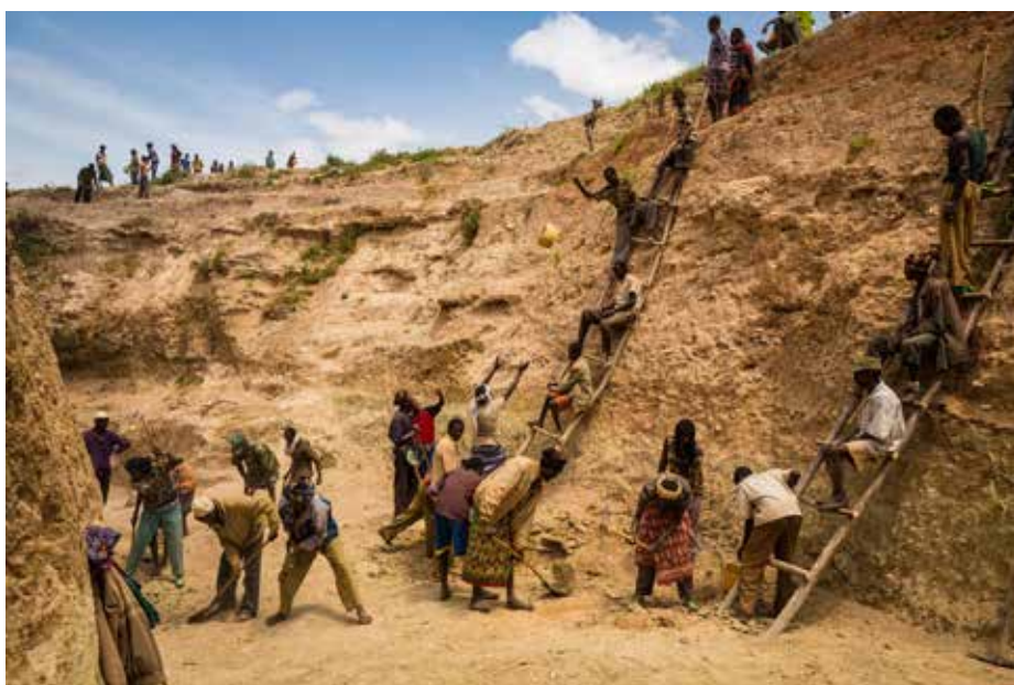
Kállai Márton: Etióp kútásók 3 , részlet a sorozatból, 2012, 30x40 cm, Digitális fotó © Kállai Márton Dél Etiópiában, Gayo falu lakói ássák a település határában található kutat. A rézsútos lejáró az állatok lehajtására szolgál, de az emberek is innen veszik az ivóvizet. A helyiek napi bért kaptak a munkájukért amit magyar emberek adományaiból finanszíroztak

Kállai Márton két sorozatában is reflektál a felbomló ökológiai harmóniára, konkrétan a víz hiányára és az emberi térryerés következtében annak romboló hatására. 4 Aknaszlatina, egy kárpátaljai sóbányász település, ahol az elmúlt évtizedben végleg felhagytak a bányászattal, de a földalatti kamrákban a beáramló édesvíz a földfelszínt is érintő rombolást végez. A környék régóta ismert a gyógyulni vágyók körében, mivel a sós fürdők és fekete iszapos kezelések kiválóak az ízületi és bőrpanaszok kezelésére. Az ehhez szükséges fürdők feltöltéséhez a bányatermekből kiszivattyúzott sós víz helyére azonban édesvíz áramlik, mely folyamatosan rombolja az egykori járatokat. Amikor egy földalatti kamra beomlik, akár 60 méter mély kráter is keletkezhet a felszínen. A fürdő-