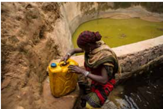
Kállai Márton: Etióp kútásók 8 , részlet a sorozatból, 2012, 30x40 cm, Digitális fotó © Kállai Márton Dél Etiópiában, Gayo falu kútjából egy helyi asszony vizet visz haza. A merítés után észlelte, hogy a kanna ereszt, ezért sietni kell vele, hogy ne veszítse el az egészet hazáig. A vizet fogyasztás előtt adományként kapott fertőtlenítő tablettával kezelik csupán.