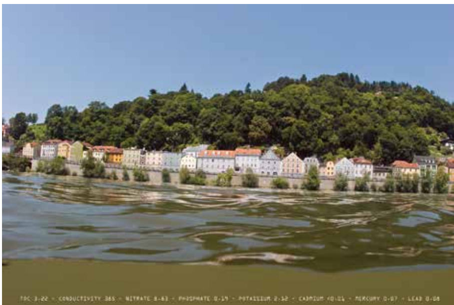
Andreas Müller-Pohle: The Danube River Project, Passau, Germany, 2005