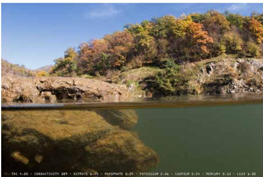
Andreas Müller-Pohle: The Danube River Project, Iron Gate, Romania, 2005

Egy folyó jellemrajzát a fotográfia eszközeivel megragadni számtalan módon lehet, unikális példa erre Andreas Müller-Pohle 2005-ben elkezdett kétpólusú Duna projektje, mely egyszerre objektív vizsgálat és művészi ábrázolásmód is. Fotósorozatában a Fekete-erdőtől a Fekete-tengerig követi a Duna folyását tíz országon keresztül. Minden fotó ugyanazon elv szerint készült, láthatóvá válik a víz felszíne alatti világ és a víz felszíne fölött megjelenő táj vagy épített környezet. Egyúttal szembe-sülünk a víz valódi árnyalataival és olyan adatsorokkal is, amelyek fotográfiai eszközökkel nem bemutatathatók, a víz minőségének objektív mutatóival. A fotográfus valamennyi fotó helyszínén vízmintát vett a folyóból, majd