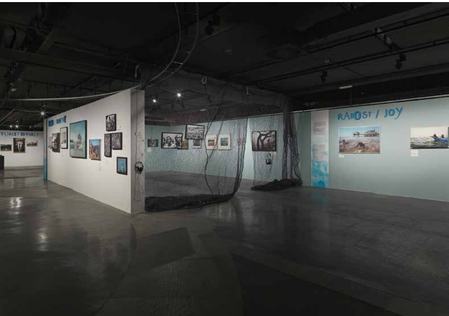
Valovanje / Ripples kiállítás enteriőr, Jakopič Gallery, Ljubljana