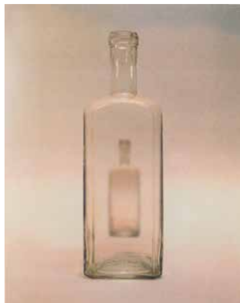
Nagy Gábor György: Morandi copy I-VII/VII. , 2000, print 40x50 cm

A művészettörténeti referencia szólhat nem klasszikus, hanem modern mesternek is. Így tesz Nagy Gábor György, amikor Giorgio Morandi csendéleteit értelmezi újra. Vajon mi rejtőzött az olasz mester magányos üvegpalackjaiban, miből merítették azok a banális tárgyak egy magasztosabb csend-élethez méltó, egzisztencialista jelentést? A mai printeken Morandi üvegei elkezdenek beszélgetni egymással. Imitt az egyik a másik felé hajlik, amott az előtérben lévő élesebben kivehető, míg a háttérbe húzódó elmosódott. Színházat látunk, a szereplők a tárgyasult, „halott” természet ( nature morte , magyarul csendélet) objektumai, amint a kortárs művész számítógépesen manipulált nyomatain életre kelnek. Sőt, megtelnek emlékekkel, érzésekkel, amelyeket a művész más sorozataiból – például a gyűjteményben is szereplő Karambol vagy a Kishalál című printekből – ismert, titokzatos golyóformák zárnak magukba. S amint a golyók bezárásra kerülnek az üvegekbe és ott mozdulatlanságra kényszerülnek, a megállított időt szimbolizálják. Eltesszük az emlékeket, mint befőtten a nyár zamatját. Szépen felkerülnek egy polcra, egymás mellett sorakoznak, figyelmünk néha az egyikre, máskor a másikra terelődik – mint Nagy Gábor György Lelkek polca című installációjában, amely alumínium di-