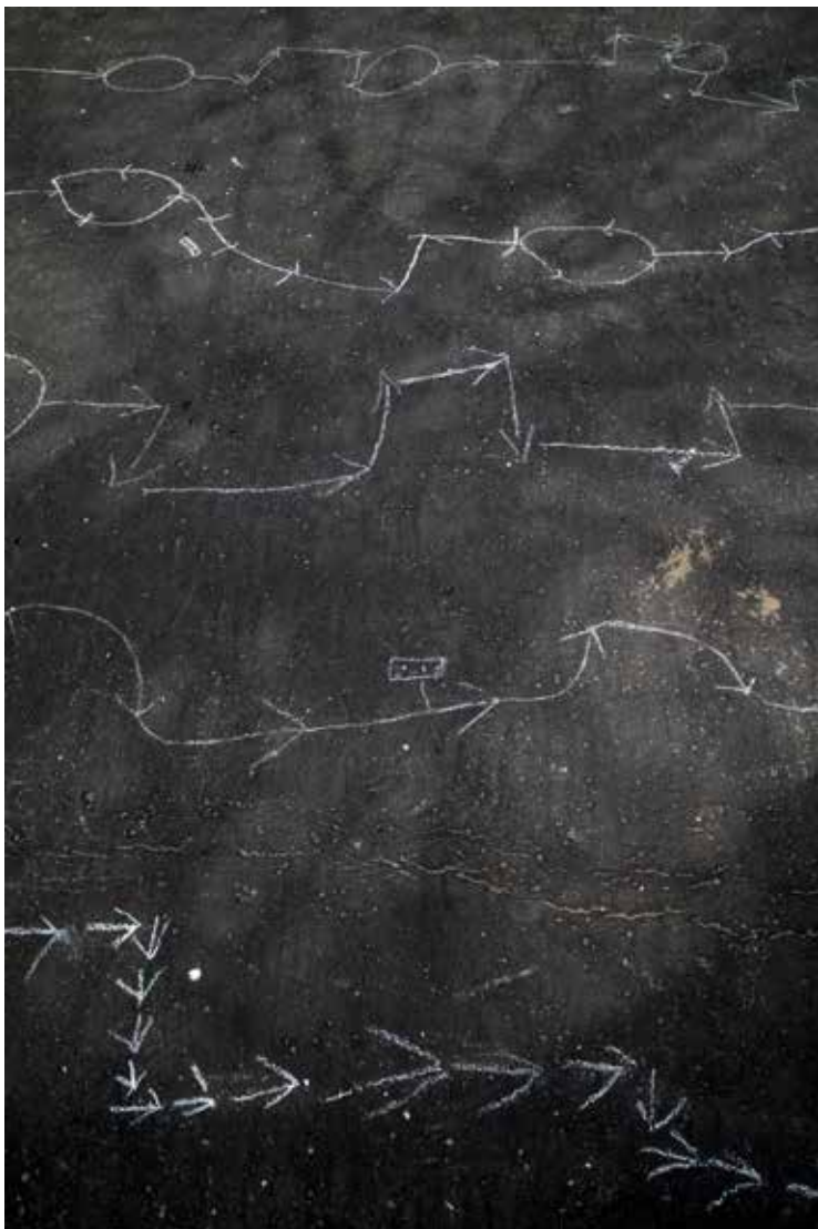
Neogrady-Kiss Barnabás: Kréta II. , 2018, 120x80 cm egyenként, keretezett, V/1

Kitalált, de az emberiség mai viszonyaitól nem is olyan elrugaszkodott szituációkat látunk Alexandra Haeseker színes printjein. A holland származású kanadai művész a Magyar Elektrográfiai Társaság egyik kiállításán szerepelt a K.A.S. Galériában. Túlélők című sorozatának számítógépes nyomatai (2012) orientációjukat vesztett, iránymutatást kereső alakokat ábrázolnak kietlen, földönkívüli környezetben.