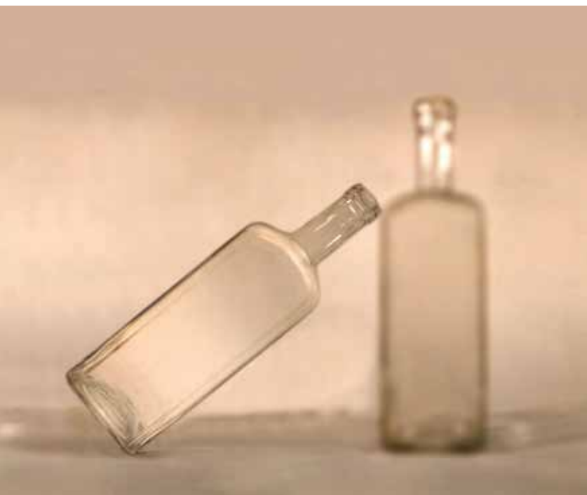
Nagy Gábor György: Morandi copy I-VIII/IV. , 2000, print 40x50 cm © Nyakas Ilona engedélyével