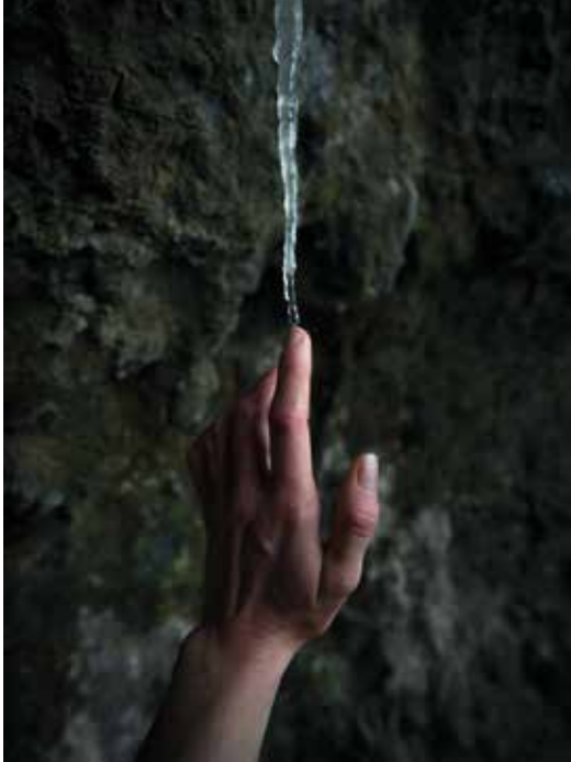
Zellei Boglárka Éva: Az Ösvény című sorozatból 2021, giclée digitális print, 50x35 cm © Nyakas Ilona engedélyével