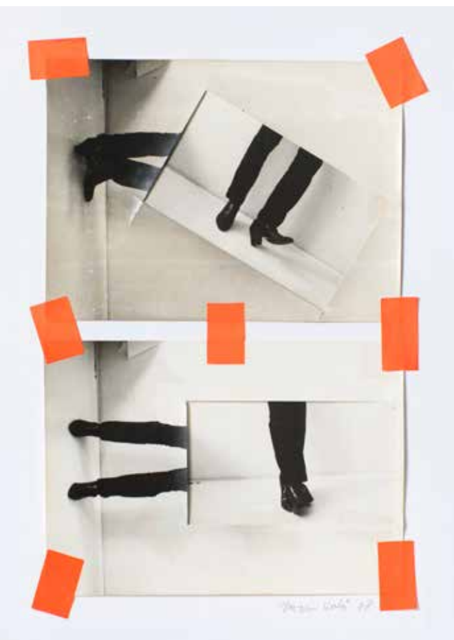
Vető-Zuzu: Lábak , 1978, zselatinos ezüst, papír, vegyes technika, 24x19 cm © Nyakas Ilona engedélyével