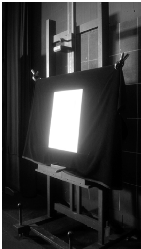
Regős Benedek: A tett , 2015, giclée nyomat Sommerset archív papíron, dibondra kasírozva kőrisfa keretben 1/5., 30x40 cm © Nyakas Ilona engedélyével

ezért értelmezi a litokövet önálló műtárgyként a művész a kaposvári diplomamunkájában ( Untitled , 2019). Sokszorosítási eljárás lehet maga a fotózás is. Műalkotásokat az elmúlt száz-százötven évben egyre gyakrabban a reprodukciójuk terjedése révén ismerünk meg. A Magyar Nemzeti Galériában már-már kultikus tárgygyá, a művészet népszerűsítéséhez elengedhetetlen segédeszközzé vált az állvány, amelyen a hetvenes évek óta befotózzák a műveket. Regős Benedek úgy döntött, a professzionális reprofotózás kontrasztjaként, erről az állványról közönségesen az okostelefonjával készített pillanatfelvételt avanzsál művészi fotóvá (2015). Az ötpéldányos giclée nyomatot igényes papírra hívta elő, dibondra kasírozta, kőrisfa keretbe helyezte: több munkát és pénzt fektetett a fotó felöltöztetésébe, mint a felvétel elkészítésébe, hiszen éppen a mű műtárggyá válásáról,