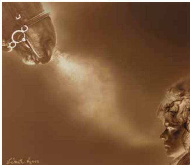
Németh Ágnes: Lélek-zet , 1997, papír, színes fotó, 64x37 cm © Nyakas Ilona engedélyével

tezésével létrehozott gabona, a tritikálé, illetve a mandulafa – inspirációjából született, s közülük a Hét törzs, egy nemzetség című kompozíció unikum, hiszen szó szerint hét analóg felvétel egymás mellé kasírozásával jött létre. Összességében, a Csizik Baláznak egy ormótlan lakótelepi tömb szinte bensőséges köztéri megvilágításáról készített fotójától Szabics Ágnes performatív installáció-fotójáig terjedő gyűjtemény eltérő felfogású művészeket képvisel, mégis jól rendezhető néhány fókuszpont köré. Ilyen hívószó a gyermek, a természet, a kognitívna magasabb rendű szomatikus-spirituális tapasztalás, az aktualizált hagyomány, hiszen ezek mind alternatívát kínálnak a profán, hétköznapi racionalitáshoz.