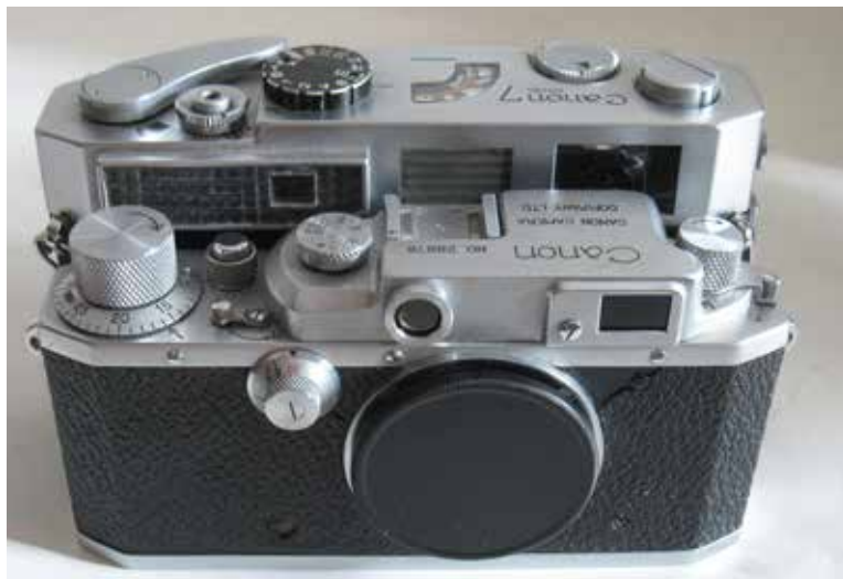
A két ismertetett távmérős Canon modell közös képe, Fotó © Fejér Zoltán György, 2022.

Azok, akik az előzőekben ismertetett műszaki felépítésű fényképezőgépekhez szoktak, a nagyobb méretű, 140x31x81 mm-es gépvázban 7 valami egészen újszerűt kaptak. A gépre tűző nap képét (például nyáron, strandon) az objektív kis pontként rajzolja ki, ami miatt a vászon redőny(zár) kiéghetett, azaz kis lyuk keletkezhetett rajta. A Canon 7-es 1 mp és 1/1000 között exponáló, fémfóliás redőnyzárával ez nem történhetett meg. Az expozíciós időket egy gombbal lehetett beállítani. A gépváz elejébe szelencellás fénymérőt építettek, a mutató a gépváz tetején foglalt helyet. A képeken is látható példányban a gyártás után 60 évvel is működik a fénymérő. Az 1964 és 1967 között gyártott 7s és az 1967 és 1968 között készített 7sZ típusba már CdS (kadmium szulfidos érzékelős) fénymérőt szereltek.