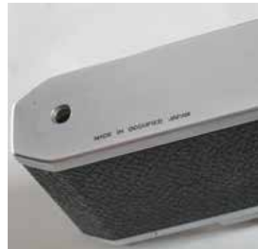
A gyártás helyére utaló felirat a gépváz alsó lemezén