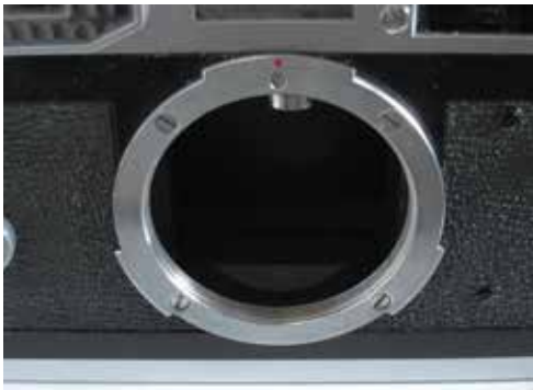
A Canon 7-es objektív-cserefogalata