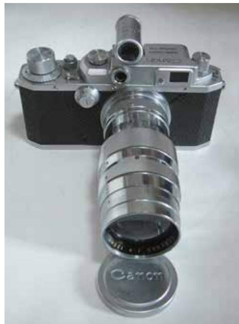
Canon IIB 135 mm-es objektívvel, ráfűzött optikai keresővel Canon 7-es 135 mm-es objektívvel, a melléhelyezett optikai keresőre nincs szükség

1952-től a japán ipar komoly fejlődésnek indult, amit a finommechanikai-optikai eszközök egyértelműen dokumentálnak. Már a Fotóművészet 1997/3-4-es számában is írtam 3 a távmérős Nikon fényképezőgépekről, azok Canonnal történő összehasonlításával mind a mai napig adós vagyok. Pedig a téma meglehetősen tanulságos.