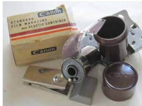
A csavarmentes Canon távmérős fényképezőgépek gyári filmkazettája