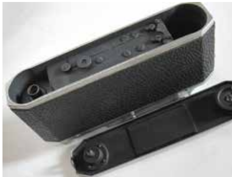
A Canon IIB filmbetöltéskor, levett alsó lemezzel