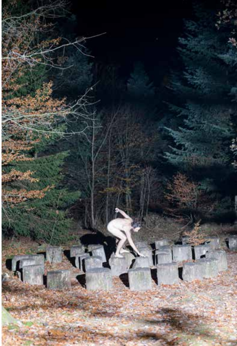
Neogrady-Kiss Barnabás: Solitude (részlet a sorozatból)

Fotósorozataiban, fotómontážsaiban keverednek a megtervezett képek a teljesen intuitív, talált szituációkról „akkor-ott” elkészültekkel, a csendéletek a spontán vagy megkomponált, performatív gesztust megörökítőkkal, fekete-fehér fényképek vegyülnek a színesek közé, de vannak már-már absztraktnak ható, sőt szinte monokróm képei is. A fénykép lehet közeli vagy nagytotál, pici részleteket akár felismerhetetlenségig nagyító. Lehet beállított, statikus, lehet a pillanatnyiség megismételhetetlenségét kimerevítő, vagy éppen a mozgást hangsúlyozó. A képein szereplő tárgyak néha csupán önmagukat jelentő élettelen dolgok, néha szimbólumok, antropomorfizálódnak vagy épp pillanatnyilag funkciót váltanak. A tárgyak, emberek vagy azok kiemelt részletei nem csupán egy kor, hely, vagy társadalom képviselői, hanem saját belső tulajdonságaiké – még pontosabban, azon lehetőségeké, melyek az individuum velük kialakított