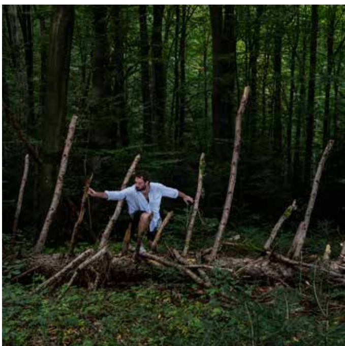
Neogrady-Kiss Barnabás: Cím nélkül

Neogrady-Kiss Barnabás: Szemmunka , enteriőr, Fotó: Simon Zsuzsanna