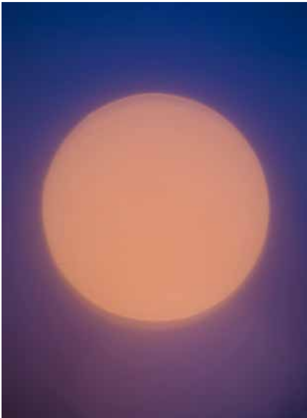
Neogrády-Kiss Bamabás: Solitude (részlet a sorozatból)