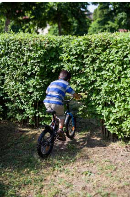
Neogrady-Kiss Barnabás: Kő, papír, zokni (részlet a sorozatból)