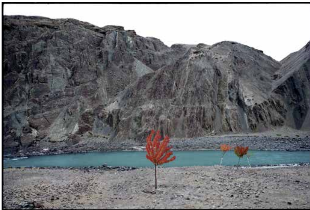
Ősz Észak- Indiában 2007. Észak-India ; Zanskar sorozat; Analog technika Lieca negatív