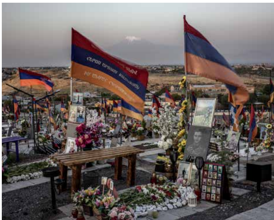
Jerablur, Hősök temetője, Jereván 2021. Jerablur; Hősök temetője; Jereván; Elveszett generációk sorozat; Digitális technika © Bácsi Róbert László

Babayan Haykanush /93/; Elveszett generációk sorozat; Digitális technika © Bácsi Róbert László