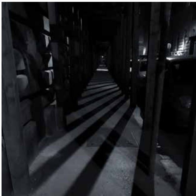
Kabai Lóránt: Cím nélkül , 2019