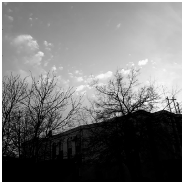
Kabai Lóránt: Cím nélkül , 2019

villanyvezeték a falban, a milliószor fotózott pozsonyi vár a Duna felett. A jelentéktelen fotózása önmagában nem lenne érdem, mivel a technika terjedésével együtt jelentkezett, és a fényképezés alapvető világra gyakorolt hatásainak egyikeként értelmezhető, amit Susan Sontag így ír le: „Fényképezni annyi, mint jelentőséget adni valaminek.” 5 De lesz-e tényleges jelentősége a fotó tárgyainak? Vagy inkább tovább bővítik az érdektelenül megmutatott képek végtelen repertoárját, hogy a semmit sorolják? A jelentőségtulajdonítás egyértelműen elmarad, ha van valami, amit erősítenek ezek a képek, az az úton levő készítő elveszettsége, és az automatizmus kényszere, ami azonban semmilyen tragikus felhanggal nem társul, ahogyan olyan tudatvesztéssel sem, mint amelyet Virilio a felpörgetett elektronikai gyorsulásra adott válaszuknak tekint.