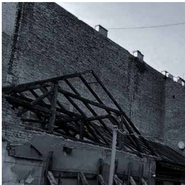
Kabai Lóránt: Cím nélkül , 2020