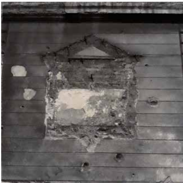
Kabai Lóránt: Cím nélkül , 2018