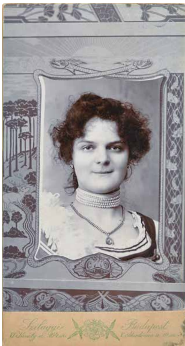
16. Szilágyi J.: Női portré szecessziós keretben , 1910 k. A nehezen azonosítható fényképész műterme az Akadémia utca 10. sz. alatt és a Király utca 104. sz. alatt működött.

Elérkezve a szecesszió időszakához a portrét környező rajzok megfrissülnek, és kanyargós, díszes, játékos mezővel keretezik a századvégi dámák arcát. Ilyen Szilágyi portréja is, amely a hivatásos fényképészek frissülő szellemét, érzékenységét tükrözi. Az amatőr fényképészek inkább a levelezőlap nagyságú, előre gyártott kereteket szerették felvételeikhez használni. Ezek a képek könnyen felismerhetők a nem szigorú beállítás, életlenség, véletlenszerűség látványa miatt. Az itt közölt spontán csoportképen a középpontban egy kutyát csodálhatunk meg, a család körül a szecessziós mezőben keringő fecskék idilli hangulatot árasztanak.