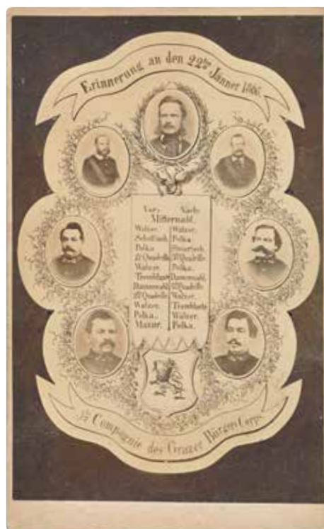
7. C. B. Schramm: Gráci Polgárok Társasága , vizitkártya, 1868. A díszes keretezés a korabeli grafikai mintákat követi.

ábrázolt valóság közé. A kereten kívül eső dolgok a maguk valóságában hatnak a szemlélő lelkére, a kereten belül az ábrázolt valóság csak a művész lelkének sajátos felfogásában mutatja be a dolgokat, készült legyen a kép akár milyen technikával, ecsettel vagy lencsével.” 12