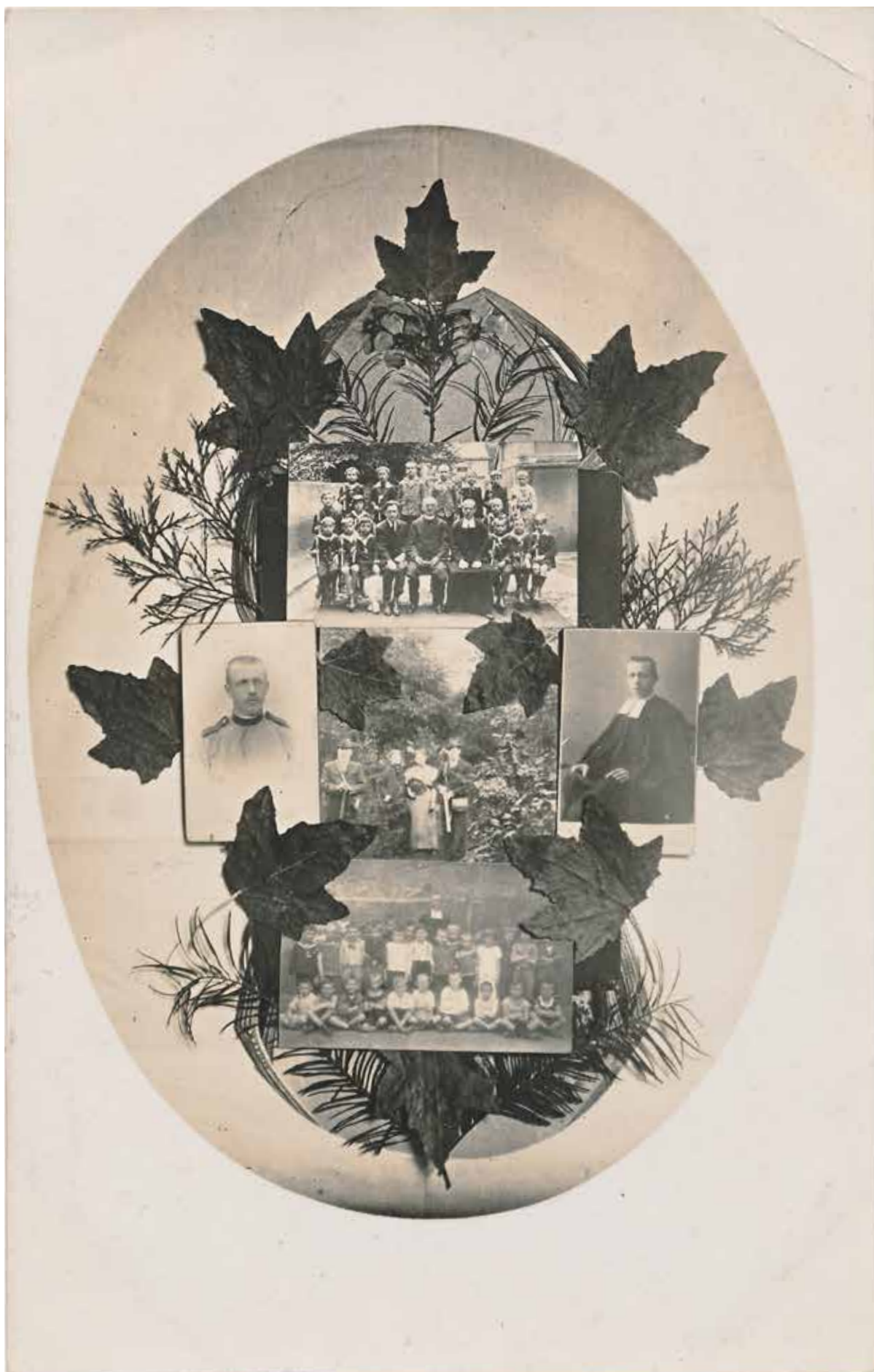
12. Ismeretlen fényképész: Tablókép koszorúban , levelezőlap 1905 k.