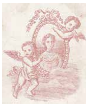
5. Ifj. Vánca Mihály fényképének verzőja, 1870-es évek vége, vizitkártya