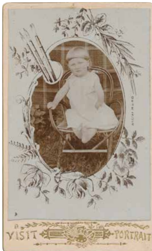
9. Ismeretlen fényképész: Kislány paletta formájú képkivágásban , vizitkártya, 1900 k. (Nyomtatta G Wagner, Wien)

A kép a képben több alkalommal feltűnt az említett kiállításban is, ezek mostani bemutatásával az iparművészet és a városi, falusi iparos mesterség területéről (vagyis a tárgytól) visszatérünk a fényképek kétdimenziós keretbe foglalt világához. Már az ókori művésztől kezdve ismerjük a koszorúkkal keretezett képzőművészeti alkotásokat. A középkori Mária-ábrázolásokból fejlődött ki, főként a németalföldi és itáliai művészetben az a festménytípus, amely virágfüzérben ábrázolta őt. A festményen belüli girland előre gyártott belső keretként funkcionált, amelybe akár a Madonnát a gyermekkel, akár uralkodók képmásait vagy a megrendelő arcképét is elhelyezhették. A barokk korszakban igen népszerű pazar virágkompozíciókban madarak, pillangók, és virágcsendéletek is előfordulnak. Néhány különleges, előre elkészített, üres fűzér is ránk maradt a múzeumi állományokban. A leghíresebb ilyen típusú kép Rubens Szűz Mária virágfüzérrel (1616) című műve, ahol meztelen puttók rendezgetik a keretező növényzetet. 16 A biedermeier osztrák képművészeti hagyomány elevenítette föl és tette újra népszerűvé ezt az ábrázolási módot. A divatot követte Schaffer Adalbert Széchenyi István apoteózis (1861) című képe, melyen a Gasser által készített portrészobrot veszi körül a koszorú. Adler Mór hasonlóan festette meg Eötvös József arcképét 1872-ben.