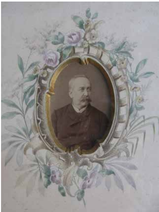
1. Ismeretlen fényképész: Férfi portré, akvarellal festett passzpartuval , (A kép még nem volt szétszedve, ezért nem tudható, hogy van-e valami jelzés a felvétel verzóján, mely utalna a készítőre.) A passzpartuba mélyített ablak aranyozott szélű, 1880 körül.