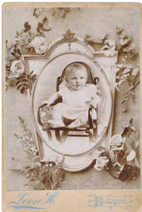
8. Leon Hermann: Kislány portréja , kabinet, 1900 k.