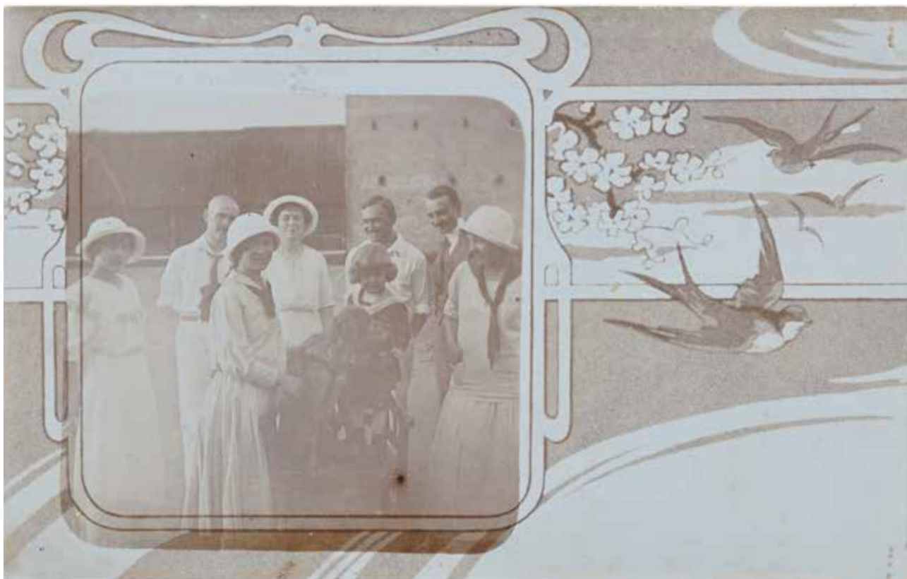
17. Ismeretlen amatőr fényképész: Család a kutyával , levelezőlap, 1910 k.