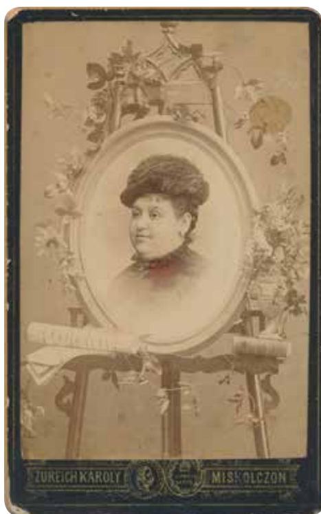
6. Zureich Károly: Női portré , Miskolc, 1880-as évek, vizitkártya (A kartont nyomtatta Leopold Türkel, Wien)