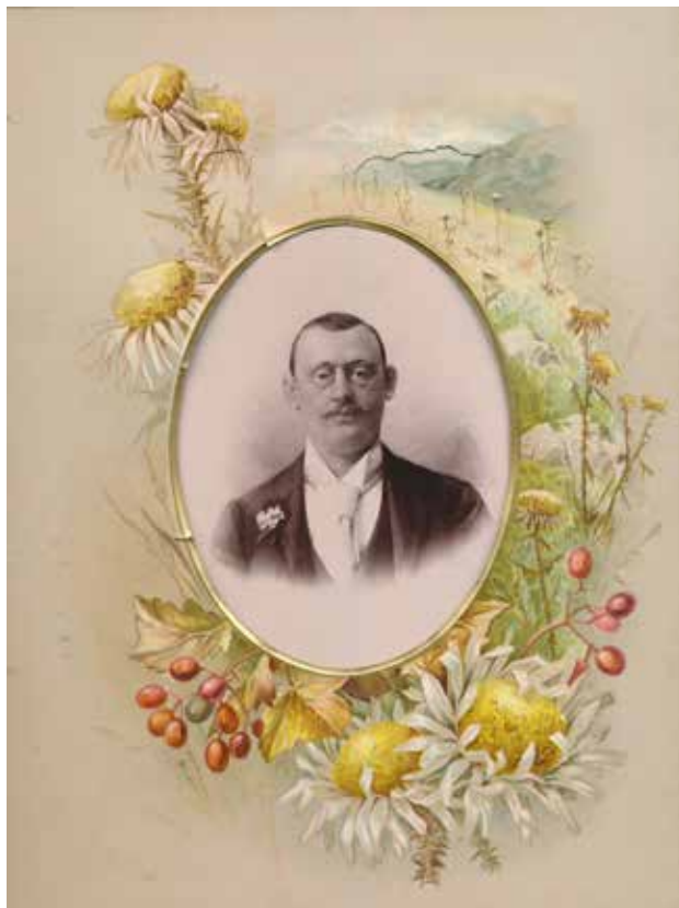
2. Díszes fényképalbum egy lapja , amelyet az egész Monarchiában használtak. A nyomdai sokszorosítással gyártott lapokból álló album olcsóbb volt, mint a kézzel színezett példányok. A díszes oldalak és a négy részből álló vizitkártyát tartalmazó lapok váltakoztak az albumban. 1900 k. ( Zur Stadt Paris felirattal) bőrkötés 27x21 cm.

A Néprajzi Múzeum jelentős fotótörténeti értékeket őrző Fényképgyűjteményének egykori vezetőjét, Fogarasi Klárát, sokan ismerik, hiszen hosszú évtizedeken keresztül dolgozott ott. A speciális gyűjtemény történetének feldolgozója 1 volt, most azonban nem mint neves néprajzi fotótörténész, hanem mint magángyűjtő mutatkozik be. Jelentős fényképkeret-gyűjteménye a Magyar Fotográfiai Múzeumban látható. Ebből az alkalomból emeljük ki körültekintő munkájának egy kis