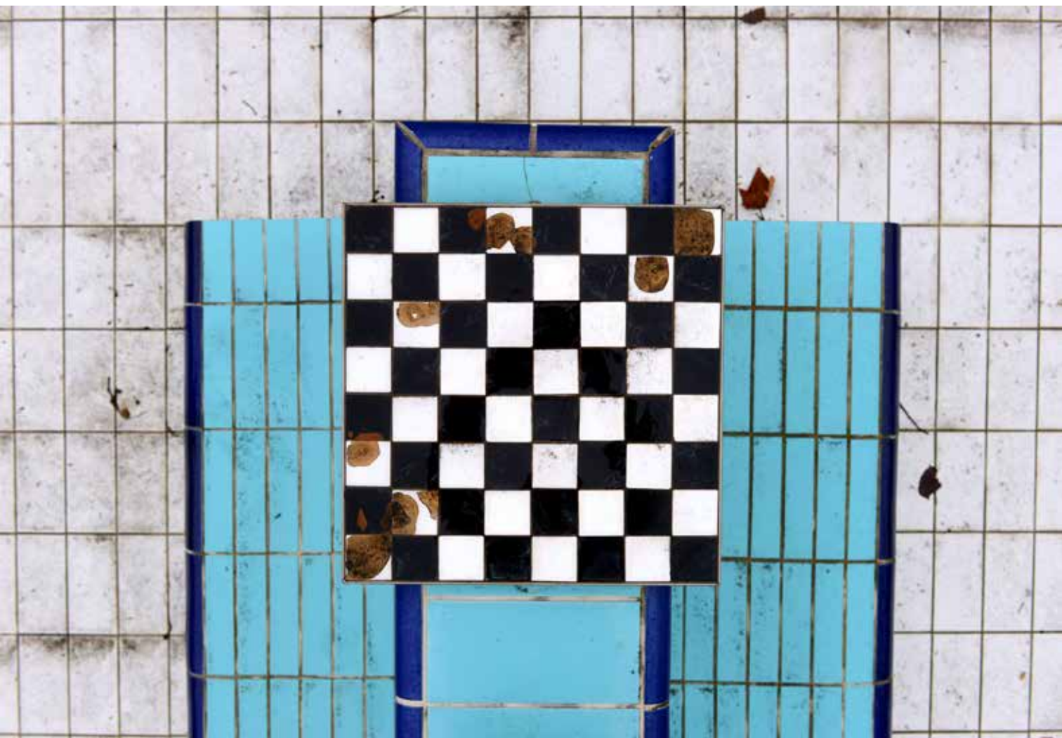
Mártonfai Dénes: Szellestrandok , 2017, @ Mártonfai Dénes