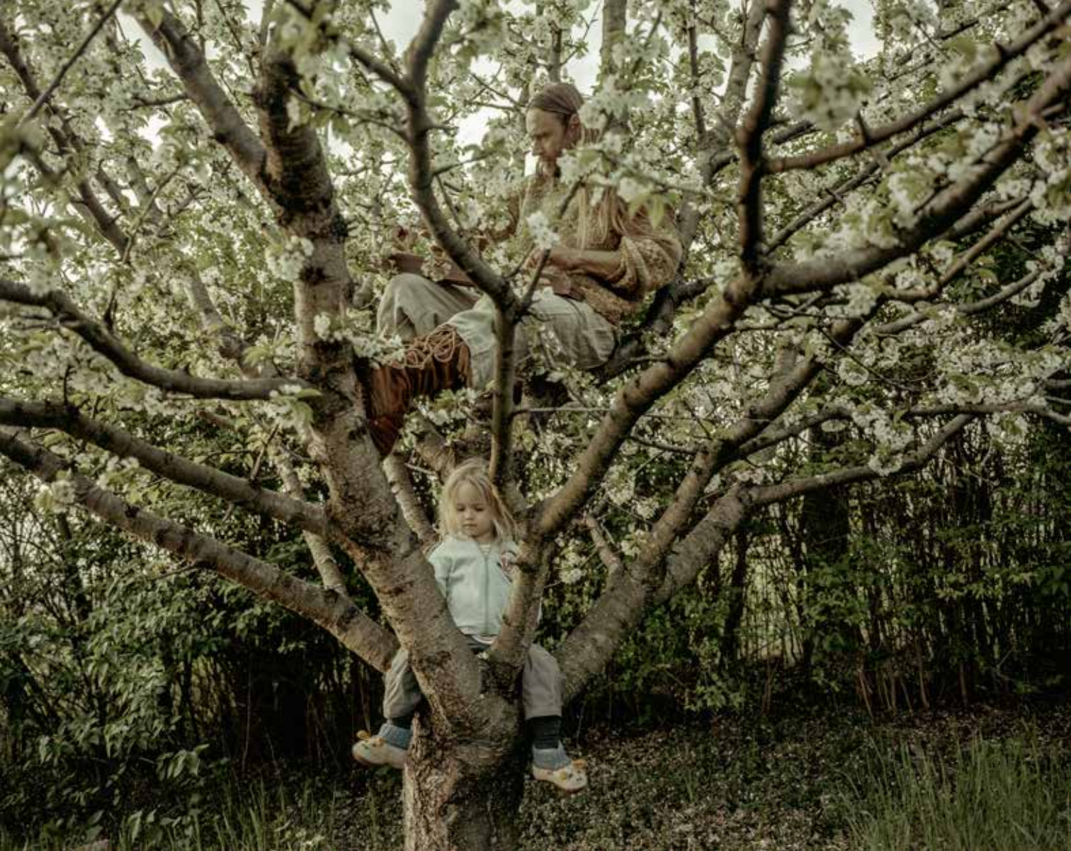
Bácsi Róbert László: Zen útja , 2016, @ Bácsi Róbert László: