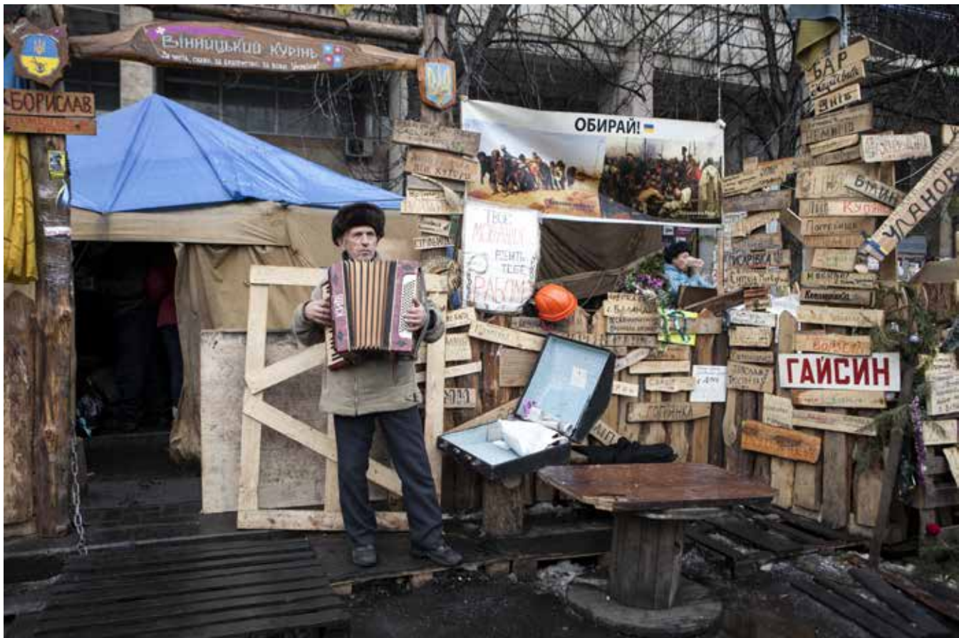
Hirling Bálint: A Majdan falu lakói, 2014, @ Hirling Bálint