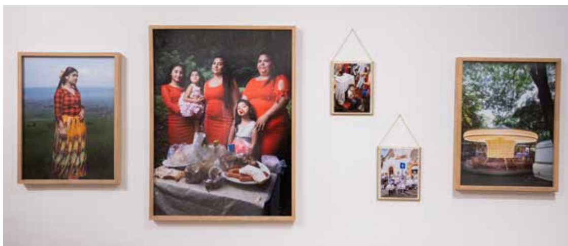
Enteriőrkép Pályi Zsófia Bűnbánók . 2018 című anyagáról, 2021, @ Capa Központ

Úgy látom, manapság a „tanúk és hírvivők” – ahogy a PC tagjai nevezik magukat – egyszerre mutatják meg a világot és a világ bemutatására vállalkozó fotográfia helyzetét.