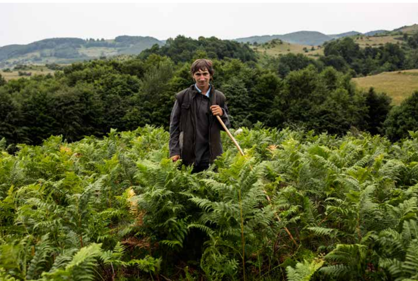
Végh László: Ottó , 2012, @ Végh László