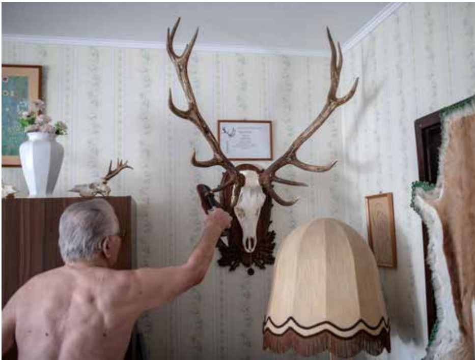
Móricz-Sabján Simon: Ipszilnok, 2016