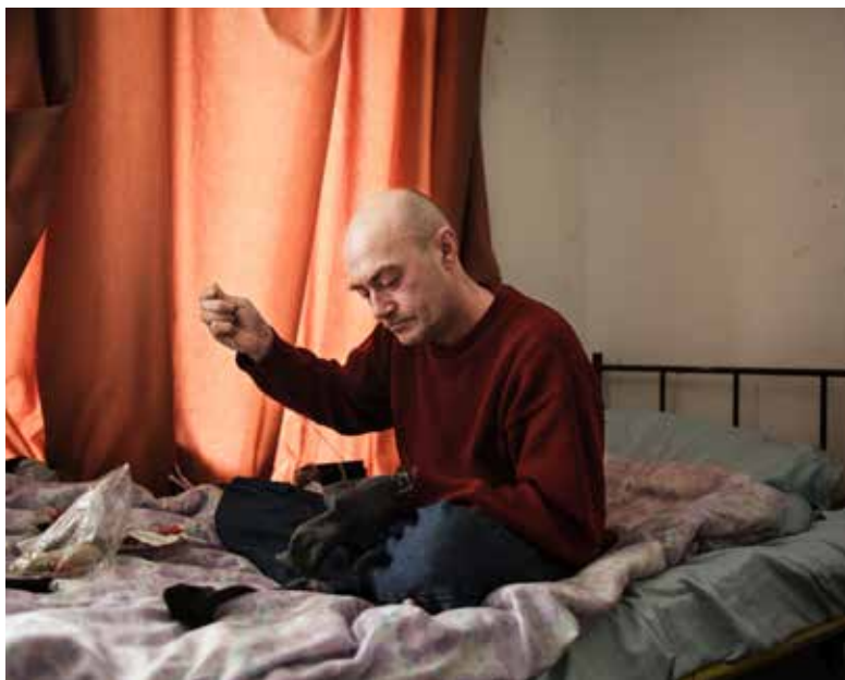
Urbán Ádám: A függöny mögött , 2018–