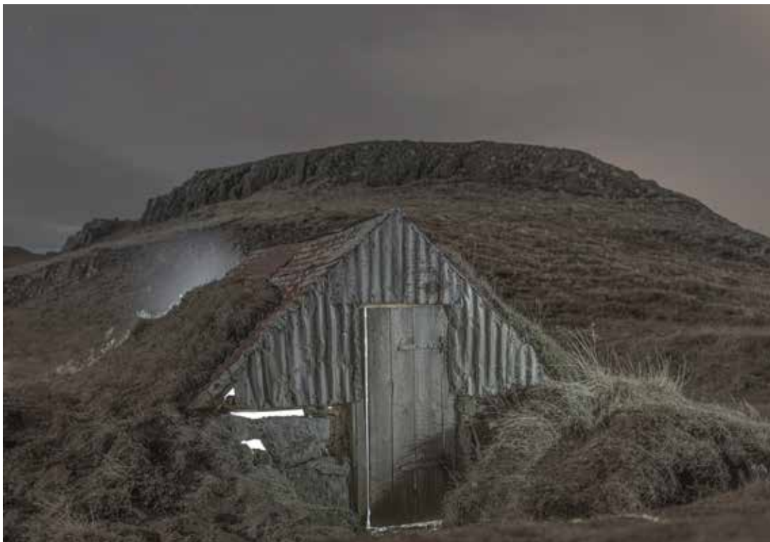
Mohai Balázs: „Észak-fok, titok, idegenség”, 2012, @ Mohai Balázs