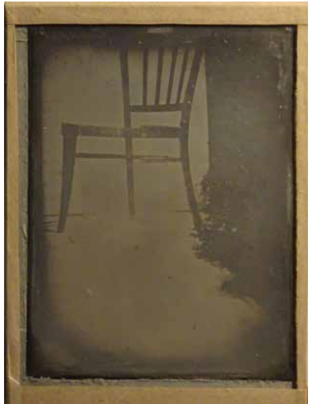
Kincses Károly: A szék , Gödöllő, 1991, dagerrotípiás

A mostani beszélgetés során szűk keretek közé vagyunk szorítva, sokféle ismert köztevékenységét nem érintjük, például fotótörténeti könyveit, szerkesztéseit, albumait, kiállítás-megnyitót, melyek közül számos megnézhető a youtube-on is. A magyar magángyűjtők sorozat részeként megjelenő rövid ismertető keretében fotógyűjteményéről kérdeztem: a gyűjtésről magáról, a dobozokban lévő képekről és azok jövőbeni sorsáról. Mint elmondta jelenleg 122 000 darabos, speciális összeállítással rendelkezik, mert nála a gyűjtés célja az, hogy minden magyar fényképész-től legyen legalább egy darab felvétele. Tehát nem követi a klasszikus gyűjtési stratégiát, hogy minél több, minél érdekesebb, egyedibb műve legyen, a képek legfőbb hasznossága az, hogy jól szolgálják azt a fotólexikont, amelyet Kincses nagyon régóta fejleszt. Ez a lexikon ma már a felgyűjtött dokumentumokból (eredeti levelek, iratok, levéltári források, könyvek, katalógusok, meghívók, interneten közölt források) megszerkesztett online életrajzokat tartalmazza. Ez a lexikon olyan abc rendben, különálló hatalmas mappákba rendezett anyagmennyiségből áll, hogy papírkötetes megjelentetésük már nem nagyon tűnik megvalósíthatónak. Számos alkalommal nyílt lehetőségem arra, hogy az egyes egységeket (mint például Borsos József, Veress Ferenc életrajzát és magukat a dokumentumokat, fényképeket) teljes egészében átnézzem, ami nagyban segítette munkámat a Borsos-monográfia megírásában és Veress Ferenc kiállításának rendezése közben is.