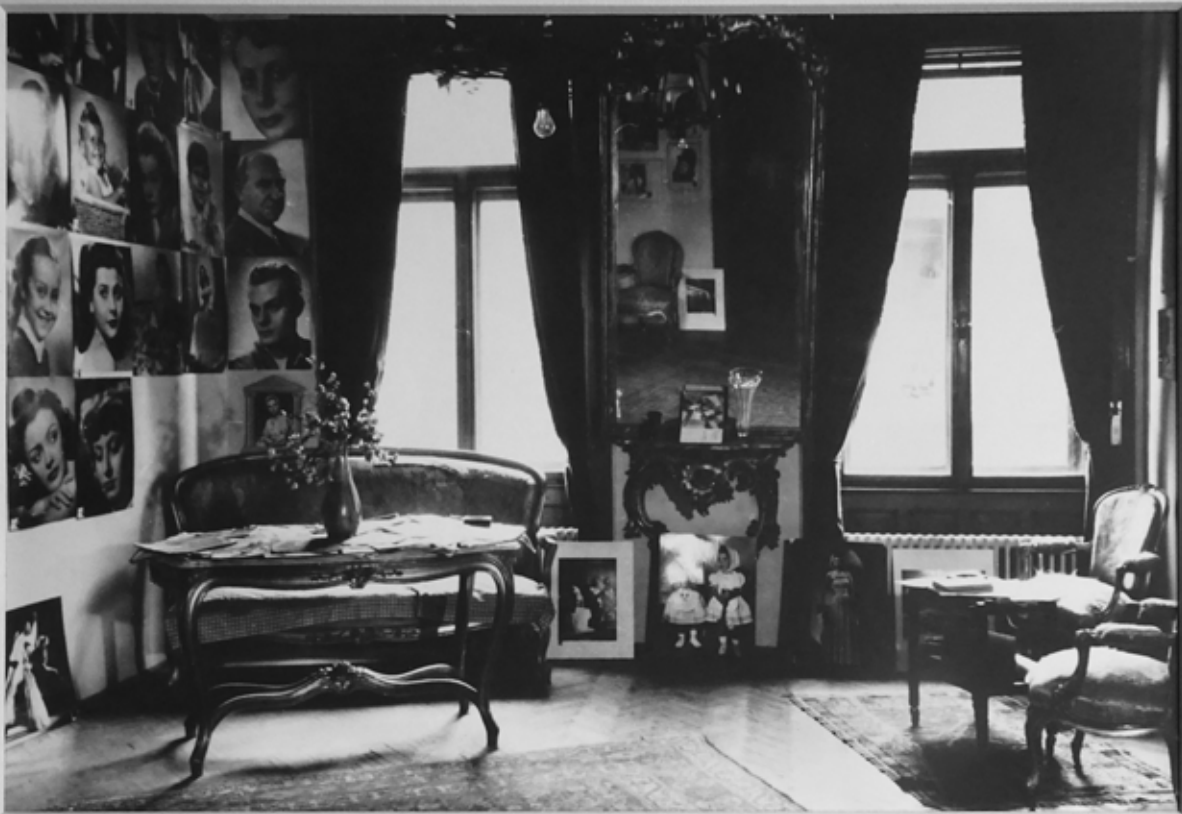
WAITING ROOM KALMAN FOTO BUDAPEST 1947