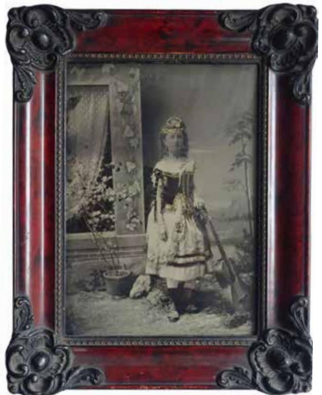
Ismeretlen fényképész: Kislány jelmezben , 1870 k., színezett ambrotípiás, eredeti keretben