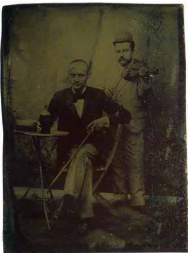
Ismeretlen fényképész: Mulató úr cigánnyal , 1885 k. kollódiumos ferrotípia

Külön kisebb egységet képeznek a negatívok, amelyekből nincsen túl sok, mindössze 1200 darab, ide tartoznak Veress Ferenc üvegnegatívjai is. Együttműködve a Veress leszármazottakkal digitalizálták az összegyűjtött fényképeket és a dokumentációt is, szinte már elképzelhető lenne egy egész életműkatalógus összeállítása is, amely mindeddig nem készült Magyarországon. Egy-egy monográfia, vagy az életművekből való válogatás nem tekinthető annak. Lehetséges, hogy ezeket is már csak az online felületeken lehet megvalósítani. Veress Ferenc fényképeinek kiállításakor nekem is volt alkalmam áttekinteni a fényképeket és a digitalizált anyagot is, ezek együttese hatásos és igen tanulságos, kivételes együttest alkotnak. A kolozsvári műterem berendezésétől, a színes kísérletekig minden altémában is találhatunk újdonságokat, nem beszélve a Veress Ferenc által használt különleges technikai kísérletekről. Az egyedi értékű fotókerámiák, selyemre fényképezés is bizonyítja mindezt.