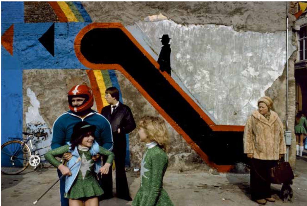
Harry Gruyaert: Belgium , Antwerp. Carnival, 1992, Courtesy Gallery FIFTY ONE I © Harry Gruyaert