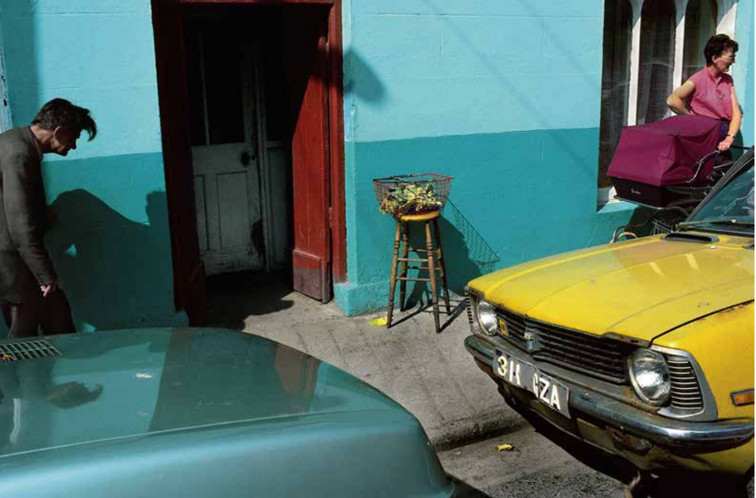
Harry Gruyaert: Ireland , County Kerry, 1983