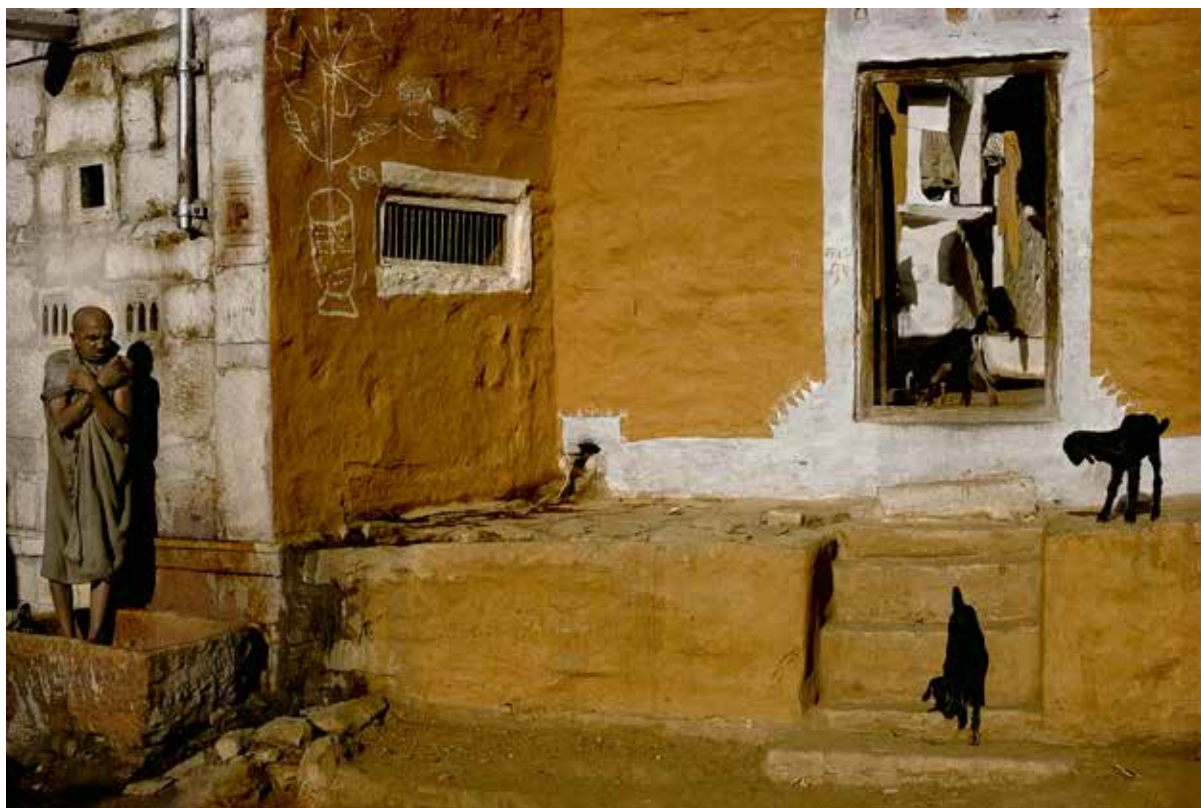
Harry Gruyaert: India , Rajasthan, 1976, Courtesy Gallery FIFTY ONE | © Harry Gruyaert