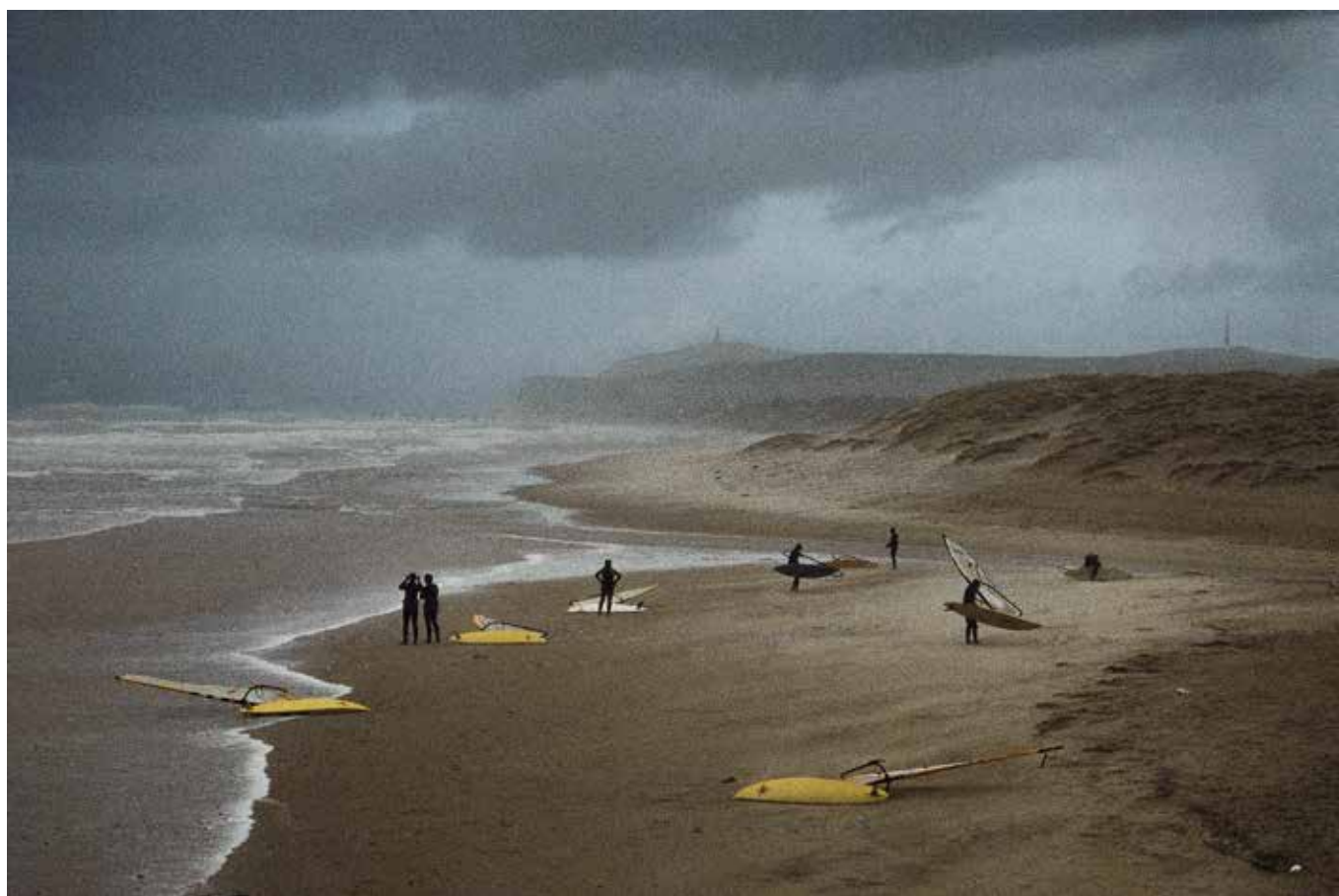
Harry Gruyaert: France , Côte d'Opale, 1998, Courtesy Gallery FIFTY ONE I © Harry Gruyaert