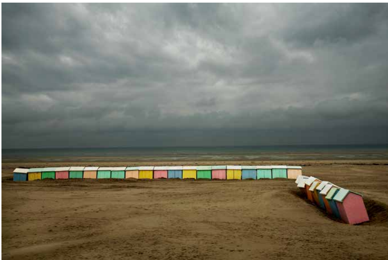
Harry Gruyaert: France , Berck Plage, 2007, Courtesy Gallery FIFTY ONE I © Harry Gruyaert