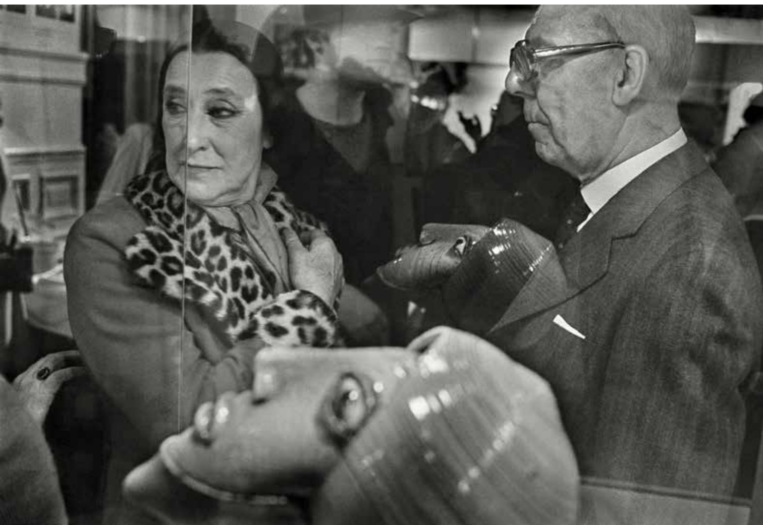
Harry Gruyaert: Belgium , Brussels. Vernissage, 1975, Courtesy Gallery FIFTY ONE | © Harry Gruyaert