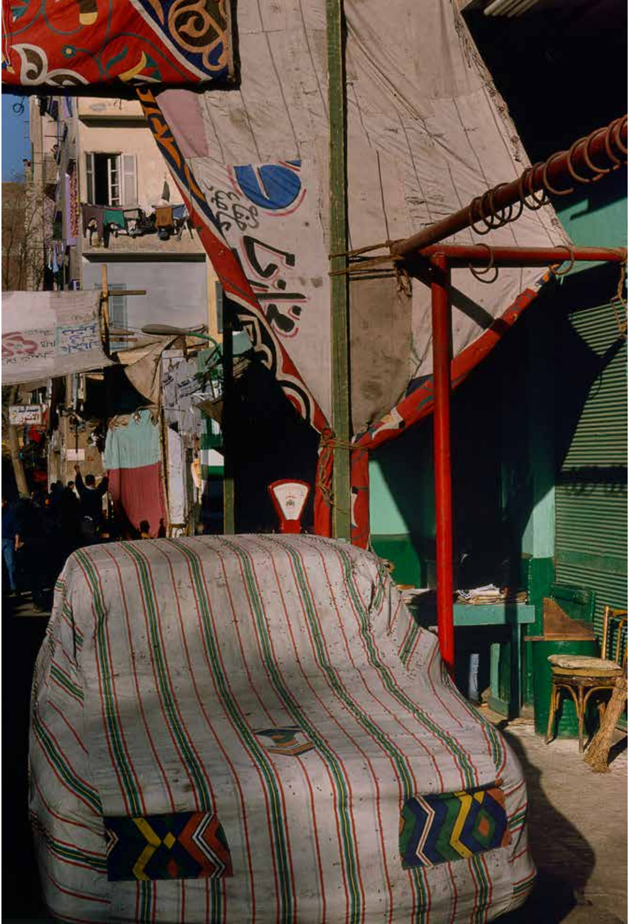
Harry Gruyaert: Egypt , Cairo, 1998, Courtesy Gallery FIFTY ONE | ©Harry Gruyaert