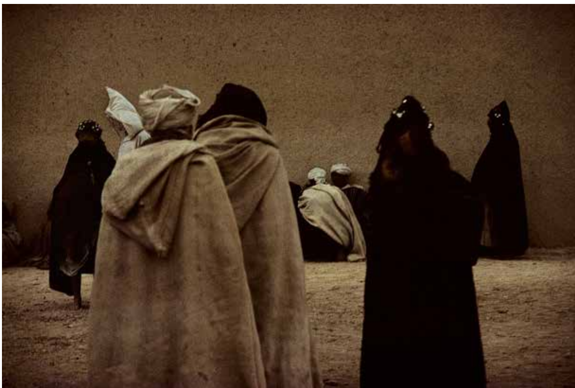
Harry Gruyaert: Morocco, High Atlas , 1976, Courtesy Gallery FIFTY ONE | © Harry Gruyaert

Az első színes televíziókészülékek képei viszont teljesen magukkal ragadták őt, így 1970-ben Londonba utazott, Richard Hamilton hazájába, akit sokan a pop art alapítójának tekintenek, és hozzákezdett a TV-Shots című sorozatához, amely erősen felnagyított, így elidegenítő hatású állóképekből áll. A leképezett tárgy pontokká hullik szét, és csak a távolból szemlélve ismerhető fel. Kritikus állásfoglalás a tarka világról, amely a nappalikban villódzott. A szín a valóságosságot sugallja, és el kell, hogy feledtesse velünk, hogy a kép lényegében nem a valóság. Ez a sorozat semmit nem veszített jelentőségéből, különös tekintettel a Facebook és az Instagram uralta digitális média mai világában. Szükségszerűen feltesszük magunknak a kérdést, hogyan egyeztethető össze ez a két nagyon különböző szándék. Gruyaert a színek segítségével alkotta meg poétikus, egyúttal egyértelműen komponált fényképeit, miközben élesen bírálta a színt, mint egy manipulált valóság szép csomagolását. A lényeg, hogy teljes egészében tisztában van a szín erejével, mint értelemadó elemmel. Talán épp a belga fotográfus tekintete volt az, amely a két annyira különféle szemlélmódot képes volt egymással összeegyeztetni, hisz mégiscsak Magritte és a szürrealizmus hazájában született.