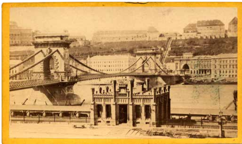
08. Bude Leopold: Császárfürdő , (a fortepan datálása szerint) 1872 k., vizitkátya