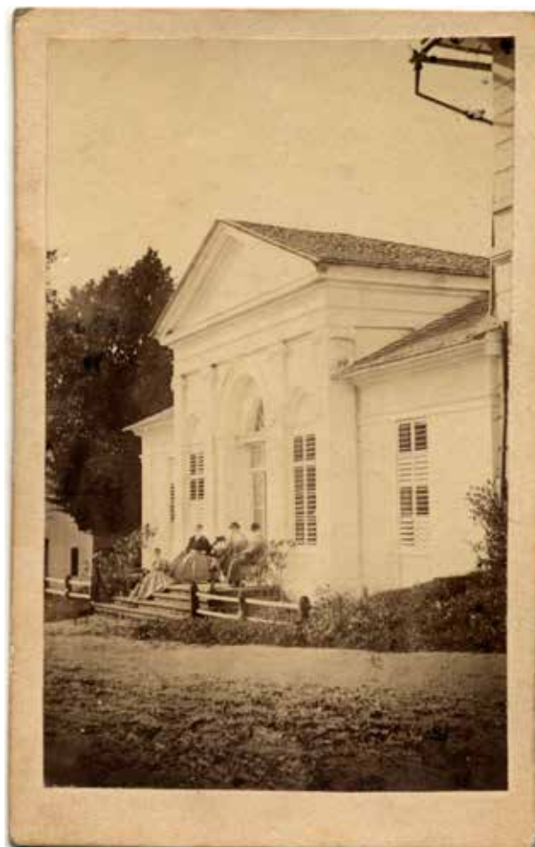
02. Foltényi Béla: Kassai kastély , 1860 k., vizitkártya

Volt, aki korlátozta a képeinek számát és ezer alatti egységet alakított ki. Ma már be lehet állítani az oldalt úgy is, hogy csak bizonyos emberek tekinthessék meg az új szerzeményeket. Fontossá vált, hogy ne lehessen könnyen letölteni, mert számosan visszaéltek vele.