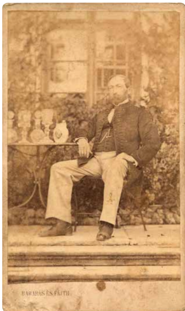
11. Ismeretlen fényképész: Huszár- vagy tüzérhadnagy 1 portréja, 1898 előtt, ferrotípiá, 6x9 cm