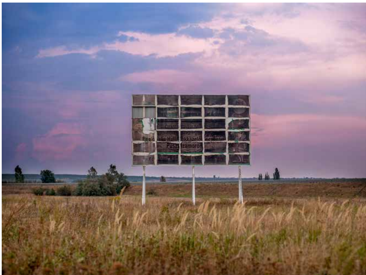
Urbán Ádám: Vizuális környezetszennyezés , 2013

Vizuális környezetszennyezés című sorozatában (2013) az autópályák, utak mentén üresen álló reklámtáblák sorát állítja elénk. Rozsdásodó, üres állványkereteket, amelyek a szemlélődő-utazó ember és a táj közé ékelődnek.