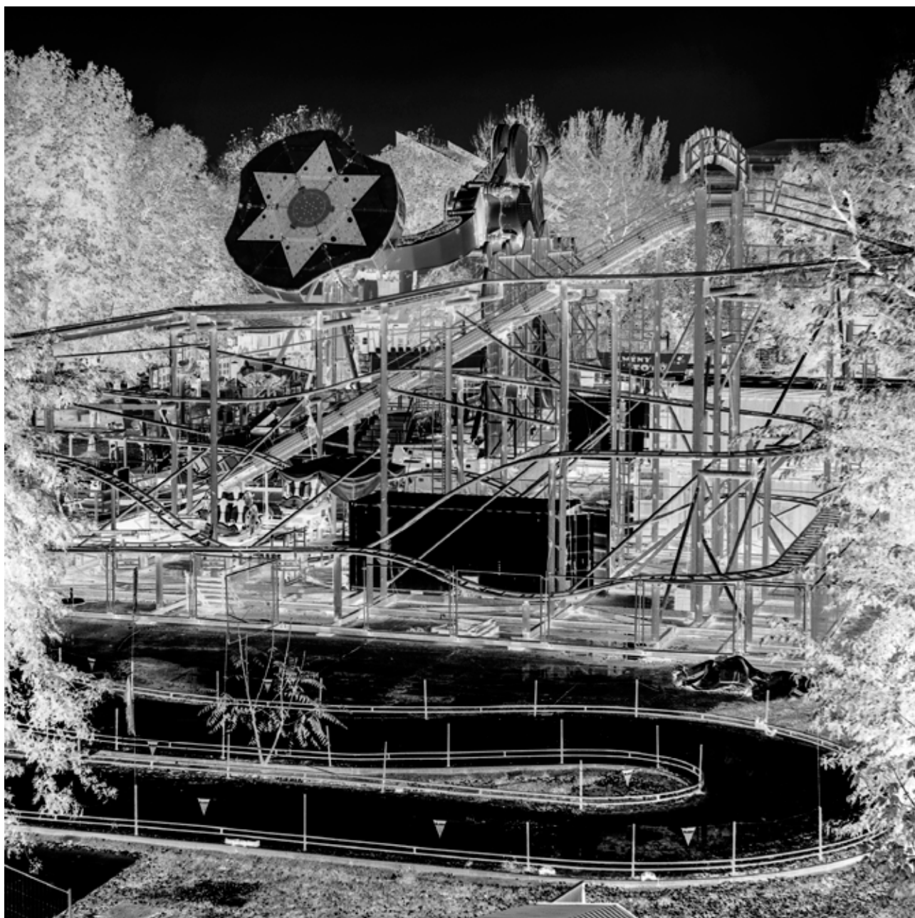
Urbán Ádám: Vidámpark-Szomorúpark , 2013