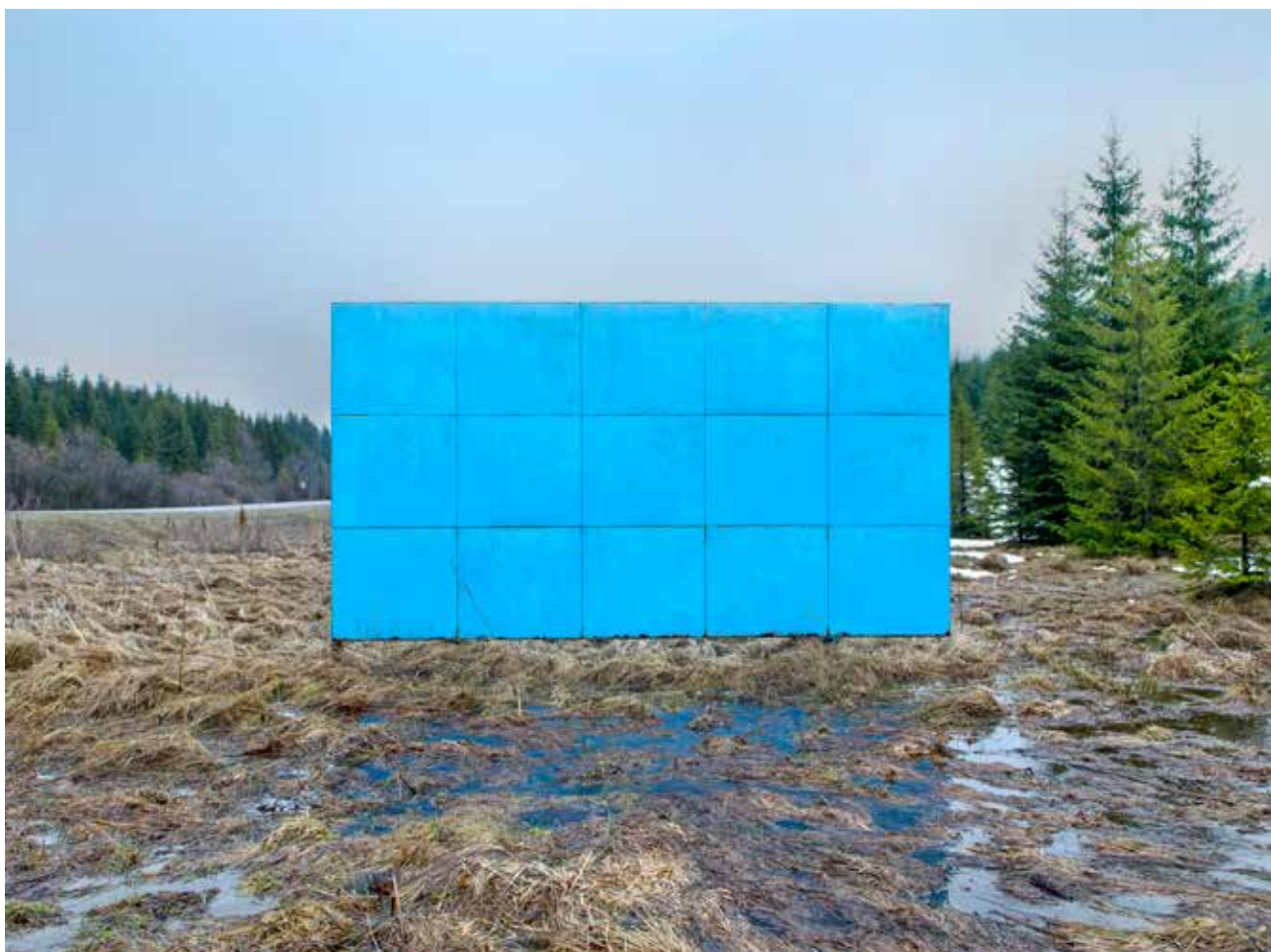
Urbán Ádám: Vizuális környezetszennyezés , 2013

ságukban, lepusztultságukkal, funkcióvesztettségükkel még zavaróbbnak hatnak, mint egy zöld táj előtt éktelenkedő reklámszlogen. A természet és az emberi beavatkozás ambivalens kettősének dokumentálásával Urbán Ádám a táj átalakulásának egy állomását rögzíti, mely mára már teljesen beépült a tudatunkba.