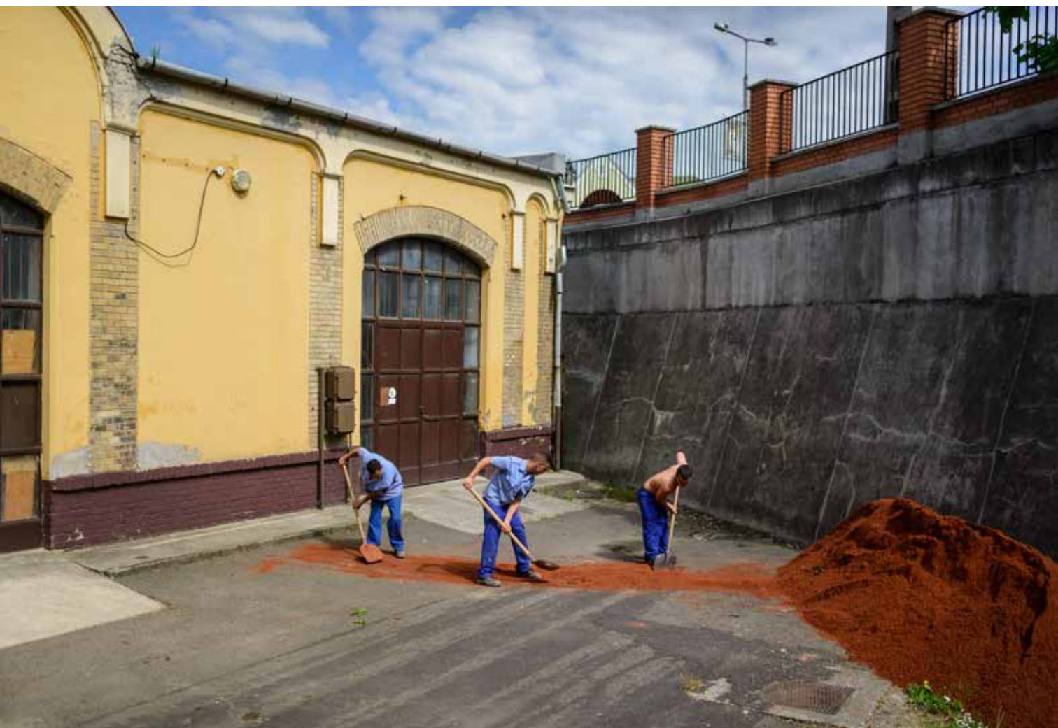
Urbán Ádám: Esély / Aszódi Nevelőintézet, 2016–18