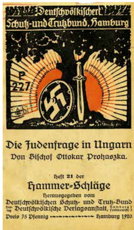
2. PROHÁSZKA Ottokár: A zsidókérdés Magyarországon, 1920.