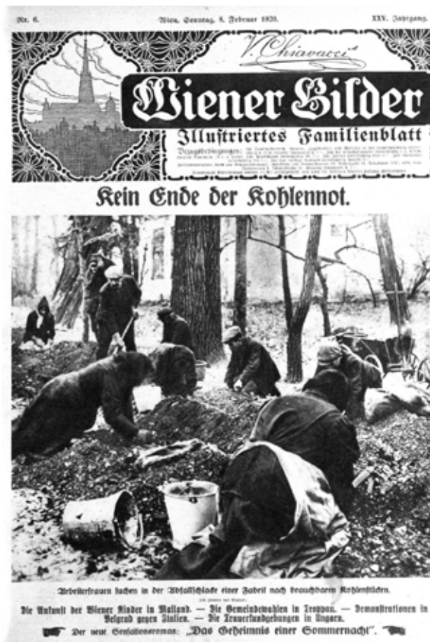
6. Wiener Bilder, 1920/6. (febr. 9.)

A Tolnai Világlapja fényképeivel jó taktikai érzékkel reagált az időszerű politikai, társadalmi eseményekre. Az 1920. március elsején kormányzóvá választott Horthy Miklós feleségét rövid két héten belül népszerűsítette a korábban már megidézett Kallós Oszkár egyik felvételével. (7. kép) A Tolnai Világlapja ennek a portrénak a megjelenítésével megelőzte laptársait. Érdemes elgondolkodni a képkeret dekorativitásán is. Nyilvánvaló, hogy az közelebb állt a neobarokk társadalom (Szekfű Gyula) vizuális ízlésvilágához, mint az 1920-as nyugat-európaihoz.