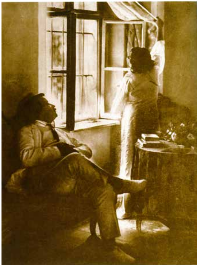
17. Balogh Rudolf: Rippl-Rónai József feleségével a szobájában , 1913, (A Fény 1913. 15., 20.)

A Fény ben megjelent utolsó három Rippl-Rónai kép Balogh Rudolf munkája, 28 felvételei 1912-ben a festő kaposvári villájába, műtermébe és kertjébe vezetnek minket. Ezek közül hét reprodukció megjelent a Vasárnapi Újságban , tehát jól ismertek. 29 A mindig kiváló fényképekkel illusztrált újságban való megjelenéssel Balogh művei „köztulajdonba” kerültek és általában már nem is jelzik a fényképész nevét a későbbi felhasználók. Ebből a sorozatból három képet találunk A Fény ben, ezek közül csak egy jelent meg a Vasárnapi Újságban . Az elsőt a művész a villa emeletén egy kis asztal mellett áll és olvas. 30 (16. sz. kép) Egy másik, igen hangulatos felvételen a művész a fotelban ül, felesége éppen az ablakot nyitja ki. 31 (17. sz. kép)