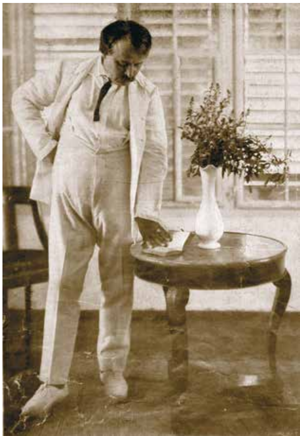
16. Balogh Rudolf: Rippl-Rónai József villájának emeleti asztalánál , 1913