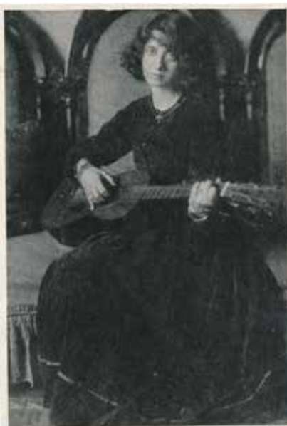
11. Máté Olga: Fenella gitározik , 1911, nyomat Szépművészeti Múzeum – Magyar Nemzeti Galéria Fényképtár