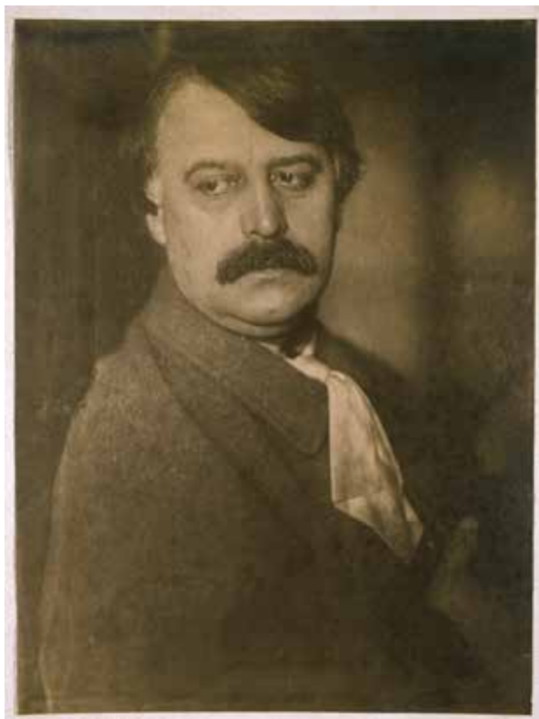
3. Székely Aladár: Rippl-Rónai József arcképe , 1909, Petőfi Irodalmi Múzeum, Művészeti Tár