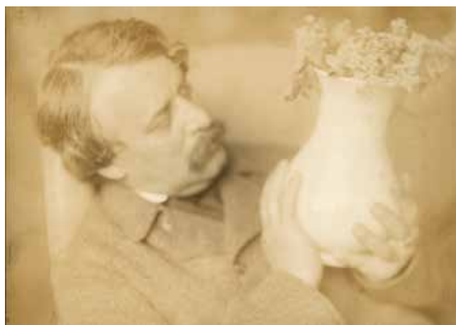
5. Máté Olga: Rippl-Rónai Józsefa vázával , 1911, Szépművészeti Múzeum – Magyar Nemzeti Galéria Fényképtár