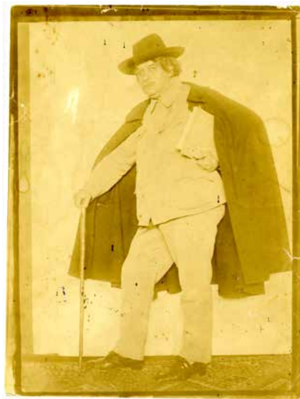
21. Rónai Dénes: A vén bohém , 1920

Nagy öröm, ha kiváló arcképekkel, változatokkal bővül a Rippl-Rónai József dokumentumtár. Korábban az egyes fényképek úgy kerültek a könyvekbe és a tanulmányokba, hogy nem jelezték, hogy ki, mikor, milyen céllal készítette azokat. Az alkotások kanonizációját jelentette, hogy A Fényben megjelentek, hiszen a lapot a Magyar Fényképészek Országos Szövetsége adta ki. Lehet, hogy az egykori kánon már nem fedi teljesen a mait, de érdekes rekonstruálni a korabeli ízlést és értékítéletet a műveken keresztül is. Rippl-Rónai József portréi valódi expozíciók, jól illusztrálják Jean-Luc Nancy meghatározását: „Egy »ennek« a »leleplezése« csak úgy történhet meg, ha műbe és aktualitásba helyeződik ez az expozíció: a festés vagy megformálás ekkor már nem reprodukálás, nem is feltárás, hanem a kitett-szubjektum előállítás.” 37