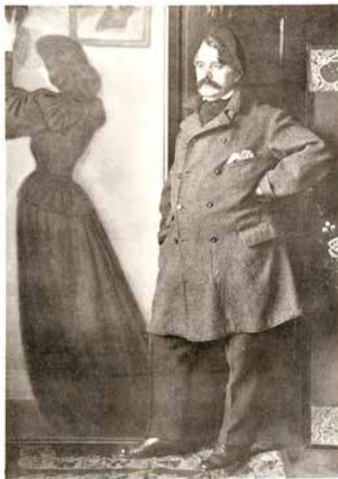
13. Máté Olga: Modell , 1911, Szépművészeti Múzeum – Magyar Nemzeti Galéria Fényképtár

15. Rippl-Rónai József: Karcsú nő vázával , 1894, mgt.